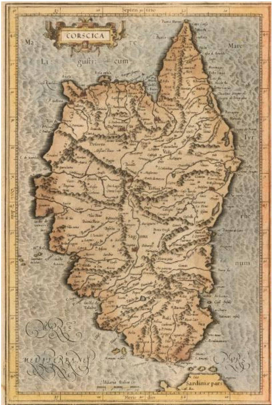
Gérard Kremer (Mercator), Sive cosmographicae meditationes , 1590.