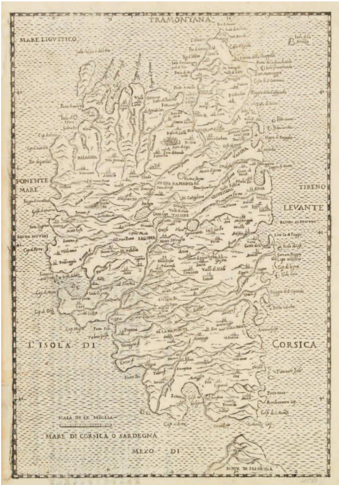
Leandro Alberti, Descrittione di tutta Italia , carte de 1567, éditée à Venise en 1568.