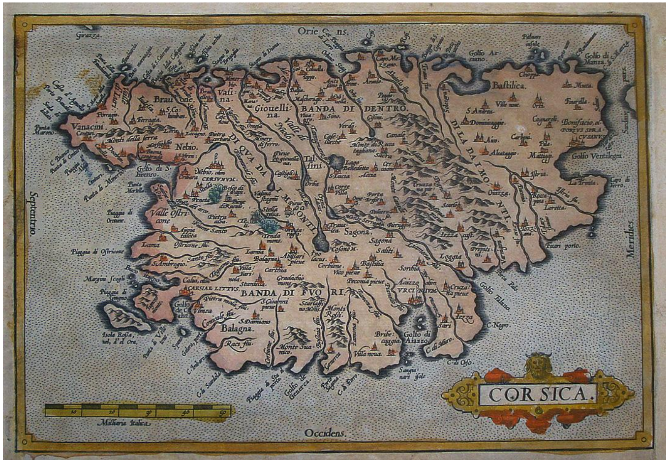
Abraham Ortelius, « Corsica », Theatrum orbis terrarum , 1572.