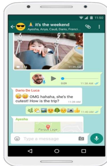
Illustration n° 1 : Photo extraite du site officiel de WhatsApp 6

C'est donc à partir de cet environnement qui donne des « instructions sémantiques fortes », comme toute affordance, que les locuteurs interagissent, et c'est ce même environnement que nous entendons analyser dans un premier temps avant d'examiner les échanges qui y sont produits. WhatsApp est en effet une application multiplateforme (dans la mesure où elle propose différents types d'échanges écrits, audio et vidéo) qui propose un dispositif communicationnel régi par un ensemble d'affordances rendant possibles des conversations multimodales et plurisémiotiques (Ghliiss à paraître en 2019).