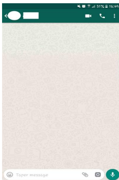
Illustration n° 2 : Capture d'écran du téléphone de l'un-e des auteur-e-s

Pour habiter cet espace, il faut d'abord s'y rendre puis mobiliser les affordances communicatives (Ghliiss et al. à paraître). L'espace est ainsi signifiant grâce à ses éléments verbaux et ses indices sémiotiques. Par exemple, l'indication « Taper message » en bas suggère à l'utilisateur l'action à effectuer mais aussi sa nature (le verbe d'action taper pour le message écrit). À gauche, l'émoticône indique la nature iconique que peut prendre le message si cette fonctionnalité est activée. À droite, il y a trois éléments pictographiques qui affordent des comportements communicatifs différents : le trombone (pour joindre un fichier), le carré à sa droite, censé figurer un appareil photo et indiquer à l'utilisateur de prendre et partager en temps réel sa photo. Enfin, le cercle en vert avec le micro à l'intérieur indique la possibilité de produire des messages vocaux en instantané.