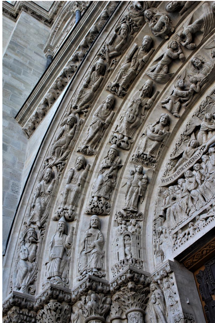
Fig. 2. Détail des voussures et du tympan du portail central, façade occidentale, basilique de Saint-Denis (cl. E. Vernerey).

nous « pourrions entendre les serviteurs du divin Mystère, que le Verbe appelle ‘colonnes’ de l’Église, des apôtres, des docteurs et des prophètes. [...] Le divin Apôtre leur ordonne d’être des colonnes quand il leur dit : Soyez fermes et inébranlables 21 ».