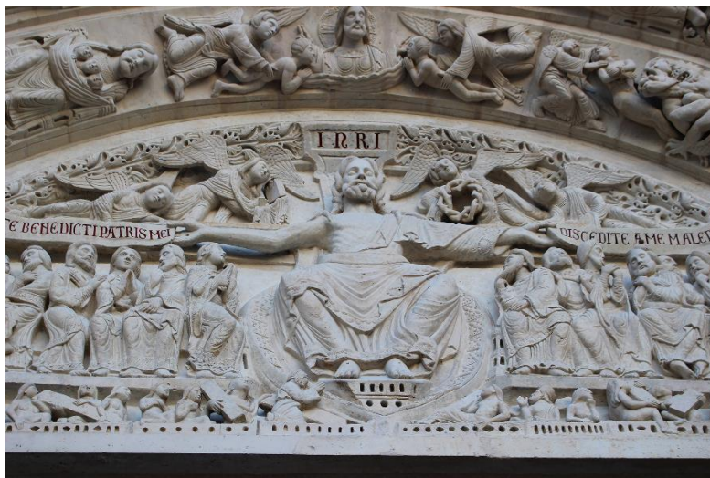
Fig. 1. Christ monumental, détail du tympan du portail central, façade occidentale, basilique de Saint-Denis (cl. E. Vernerey).

La reconstruction de la basilique de Saint-Denis au XII e siècle est pensée autour d'une idée centrale qui se manifeste tant dans son architecture et ses images que dans la réforme de son clergé et la mise en œuvre de sa liturgie 1 . Il s'agit de l'articulation de l'ancien et du nouveau et de leur harmonie, soit du principe de divergence et d'union autour de Dieu. Cela a été mis en évidence par Erwin Panofsky qui a étudié l'importance des anciennes bases pour les nouvelles et l'articulation entre la façade et l'intérieur 2 . Toutefois, si les études sur l'abbatiale sont pléthores, le rôle de l'image comme lien entre le lieu et les principes topologiques reste, semble-t-il, à réaffirmer. La sculpture monumentale est matérialité inscrite à même l'architecture. Son appréciation suppose néanmoins un détachement face au sensible moyennant le discours figuratif ; le propos narratif renseigne alors possiblement les fonctions spirituelles du support dont il dépend. Ce lien de l'image au bâti a été mis en avant par Otto Von Simson, remarquant l'influence de Maxime le Confesseur à ce titre. L'auteur voit dans la Mystagogie l'une des sources du principe dionysien d'harmonie microcosmique de l'architecture et de l'image prenant modèle sur celle, divine, du macrocosme 3 . Sur la base de ces considérations, une brève étude du portail central occidental et de ses relations avec le lieu peut être menée.