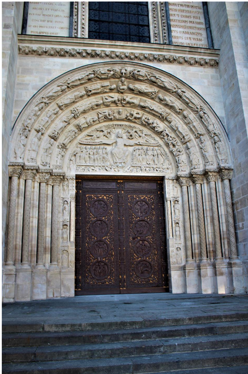
Fig. 3. Portail central, façade occidentale, basilique de Saint-Denis.

Ce rapport étroit entre architecture, iconographie et mystique est très présent dans l'œuvre de Maxime le Confesseur. À Saint-Denis, là où la partie haute du portail semble l'image du sanctuaire, que ce dernier définit comme le lieu de la lumière, de l'union des clercs, et de l'eucharistie, la porte sculptée est vraisemblablement celle de la progression dans la nef. Pour le théologien, l'avancement dans la nef, simultané à la proclamation de l'Évangile, consiste en une purification progressive du corps. Celle-ci est le reflet d'une compréhension accrue du texte biblique, allant du sens littéral vers le sens mystique atteint dans le sanctuaire. Sur les montants du portail, les Vierges sages et folles, dans des arcades architecturées, sont probablement les