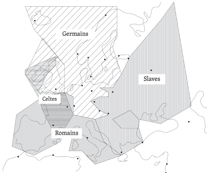
Ill. 2 : Les géographies imaginées de la philologie comparée, par l'auteur de l'article.

Une analyse de l'histoire des géographies imaginées de l'Europe du Nord devrait bien entendu être plus détaillée que les quelques points que je viens d'esquisser. Il est cependant clair, désormais, que ces géographies ne sont pas stables, mais dépendent des besoins discursifs et identitaires de chaque époque, chaque utilisateur, chaque personne qui parle du Nord. En vue de la définition de l'Europe du Nord par notre revue, il est évident qu'il est tout à fait possible d'établir une telle nouvelle définition de l'Europe du Nord si nous en ressentons le besoin, et l'histoire du discours de l'Europe du Nord ne contredit pas notre vision, même si elle ne la soutient pas non plus. Est-ce qu'il y a peut-être d'autres raisons plus valables ?