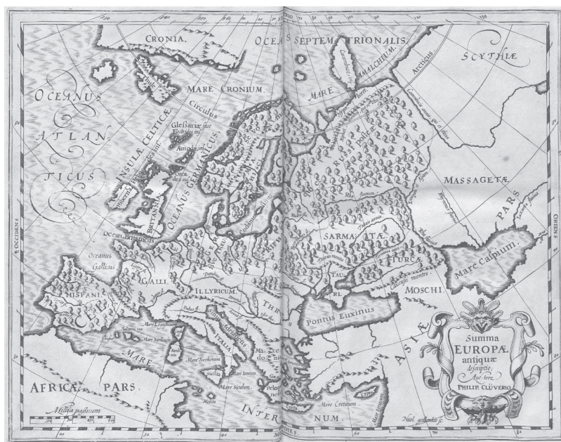
Ill. 1 : Philippi Clüveri[i] Germaniae Antiquae Libri tres : Opus post omnium curas elaboratissimum, tabulis geographicis, et imaginibus, priscum Germanorum cultum moresque referentibus, exornatum , Leiden, 1616.

monde comme des descendants d'un seul peuple qui aurait habité une région spécifique au Nord des Alpes, c'est-à-dire des Pays-Bas ou de la Scandinavie? Du point de vue géographique, le résultat de ces efforts était similaire – il apparaît une Europe du Nord qui se distingue de l'Europe du Sud, le Sud étant l'héritier direct du patrimoine classique gréco-romain, et le Nord certes influencé par ce patrimoine, mais avec des ancêtres distincts.