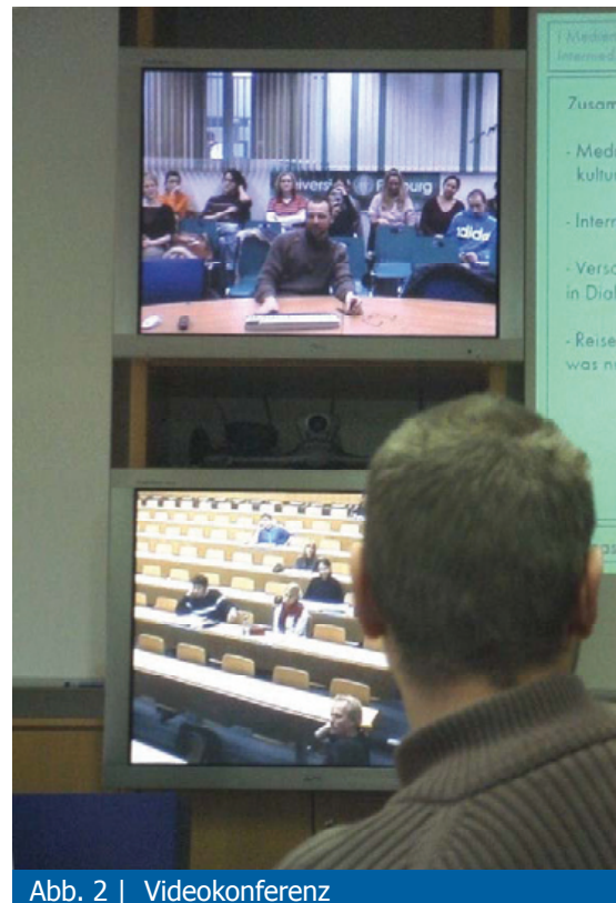
Abb. 2 | Videokonferenz

Die Lehrveranstaltung wird von Dozierenden aller beteiligten Institute im Wechsel durchgeführt. Mittels Videokonferenz und Netmeeting 6 werden die Vorlesungen samt Präsentationen an die Partnerinstitute übertragen (vgl. Abbildung 2). Die Studierenden hören also dieselben Vorlesungen. Unterrichtssprache ist in diesem Falle deutsch, da in den Studiengang der Strasbourger Studierenden Deutsch als Hauptsprache eingeht. Die skandinavischen Sprachen werden zum Zeitpunkt der Vorlesung erst erlernt. Prüfungen, die für alle Studierenden gleich waren, wurden im ersten Durchlauf unter Einsatz der Lernplattform OLAT realisiert. Aus praktischen Gründen wurde im zweiten Durchlauf lokal geprüft.