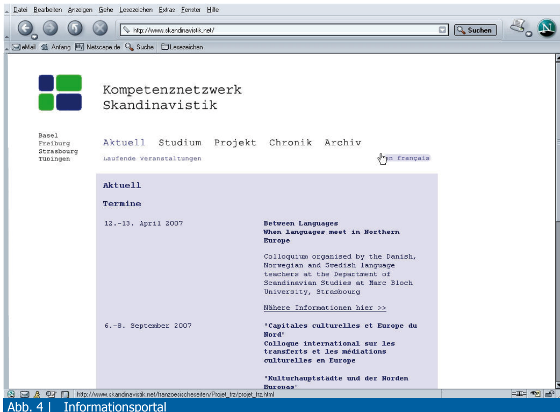
Abb. 4 | Informationsportal

Die technische Basis für die netzbasierten Seminare bilden die an den Universitäten je vorhandenen Lehr- und Lernplattformen. Bisher wurden die Lehr- und Lernplattform der Universitäten Freiburg (CampusOnline, basierend auf clx der Firma imc), Tübingen (Ilias) sowie seit