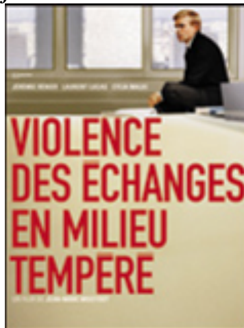
Document n° 1 Affiche de la sortie commerciale

Cette simple composition semble porter témoignage du passage d'une fonction d'encadrement de subordonnés à une fonction isolée de consultant autonome. La photographie épurée offre