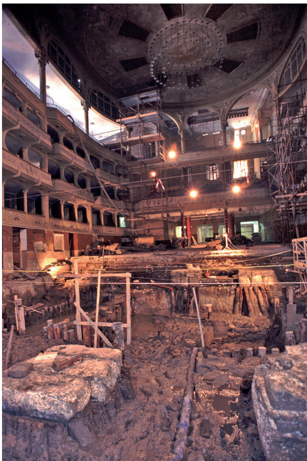
Fig. 2 – Les fouilles de l'ex-Teatro Malibran (photo: Archeoassociati Bettinardi Cester, autorisation du Ministero dei beni e delle attività culturali e del turismo; reproduction interdite).

et radiocarbone et permettant d'obtenir des datations de haute précision. La bonne synchronisation mise en évidence entre les séquences en chêne des deux premiers sites analysés, le Teatro Malibran et l'ex-Cinéma San Marco, a permis d'établir une chronologie pour le Veneto oriental, longue de 250 ans, qui comprend les 42 séries de ces deux sites vénitiens et les séries de deux artefacts du Veneto. Le dernier cerne de cette chronologie du chêne est daté de l'an 699 \pm 21 cal AD. Les échantillons en bois d'orme de l'ex-Cinéma San Marco ont été datés sur cette chronologie du Haut Moyen Âge 5 .