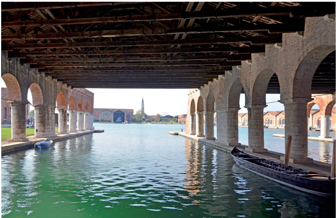
Fig. 8 – Arsenale – Gaggiandre.