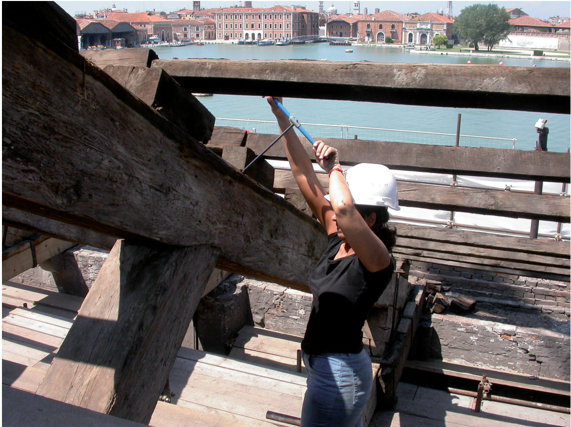
Fig. 7 – Arsenale – Isolotto: prélèvement avec la tarière de Pressler.