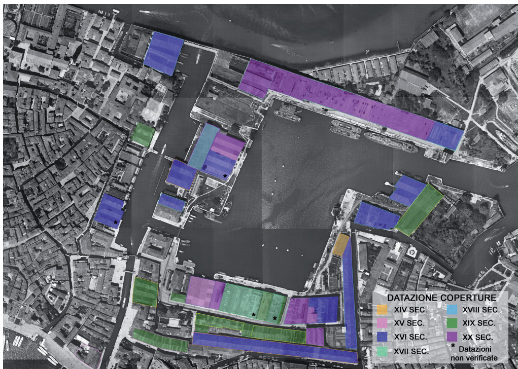
Fig. 6 – Les bâtiments de l’Arsenal de Venise : datations des fermes des toitures d’après les sources historiques (dessin Giulia Bettiol, in Menichelli, 2009).

datées entre 1866 et 1884 pour ce qui concerne les fermes Polonceau du bâtiment A et entre 1869 et 1894 pour ce qui concerne les structures du bâtiment B. Les poutres en sapin de la soupenne du même édifice sont postérieures à 1950. Les bois des Tese alle Vergini sont parfaitement contemporains de la date de la construction du bâtiment, placée entre 1873 et 1888, contrairement à ceux des Artiglierie qui témoignent d’une reprise des charpentes au XIX e siècle (la construction originelle remonte au XVI e siècle). La présence, déjà mentionnée, dans les charpentes du XIX e siècle d’éléments plus anciens, témoigne de l’utilisation de poutres de remploi, provenant probablement d’édifices démolis à l’intérieur du complexe de l’Arsenal ou récupérées des structures des Artiglierie même 12 .