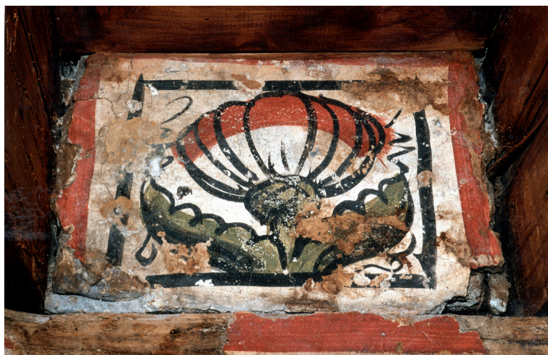
Fig. 5 – Détail de la décoration à fresque sur le mur entre les poutres (photo : C. Menichelli).

photographie. Même si un nombre limité d'éléments a été examiné, nous avons réussi à les dater. Le dernier cerne des échantillons datés (dont la moyenne est composée de trois poutres et une planche, toutes en épicéa), est situé entre les années 1446 AD et 1452 AD. L'absence du cambium et l'appartenance à une essence sans aubier visible ont limité la précision des résultats : 1452 AD est le terminus ante quem de la construction (cela signifie que dans ce cas, plusieurs années ont pu s'écouler entre cette date de 1452 et la construction). Il faut souligner que la grande convergence des dates et le fait que plusieurs échantillons ont leur dernier cerne daté de la même année suggèrent une hypothèse de datation pour la réalisation du plafond qui ne devrait pas être postérieure à 1480 AD. Cette datation du plafond en bois est particulièrement intéressante car elle a permis de situer dans le temps la phase de construction principale, du bâtiment, et du plâtre décoré à fresque, qui est certainement contemporains du plafond en bois 10 .