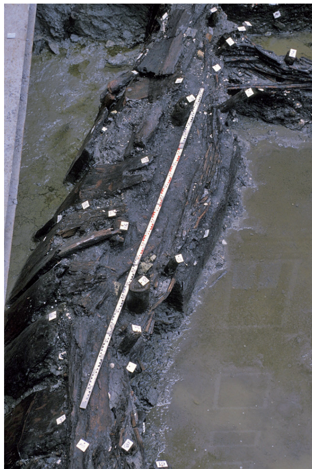
Fig. 3 – Détail des structures en bois de Ca' Foscari.

Plus récentes de vingt-neuf ans, les structures en bois du site de l'ex-Cinéma San Marco (fouillé en 2000) sont réalisées avec des arbres abattus durant l'automne-hiver 691/692 cal AD.