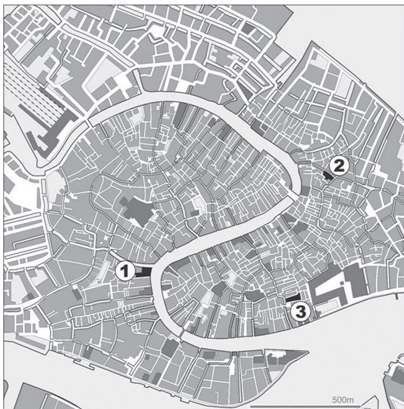
Fig. 1 – Localisation des sites archéologiques du Haut Moyen Âge : 1) Ca' Foscari, 2) Teatro Malibran, 3) ex-Cinema San Marco; dans le cadre en bas à gauche, la surface fouillée de 22 m de longueur; nouvelle élaboration par Meadows et al. 2012, dessin de J. Meadows d'après une figure de Fozzati et Cester (2005).

À partir des années 1990, une intense collaboration a été entreprise entre le laboratoire de dendrochronologie de la société Dendrodata s.a.s. de Vérone et la Soprintendenza per Beni archeologici di Venezia e Laguna et la Soprintendenza per i Beni Architettonici di Venezia pour l'étude systématique des structures en bois découvertes dans les fouilles archéologiques ou devenues accessibles au cours des travaux de restauration.