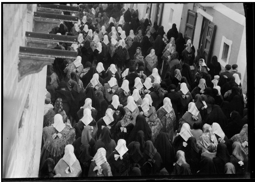
Raoul Hausmann, Procession à Sant Antoni de Portmany, 1934