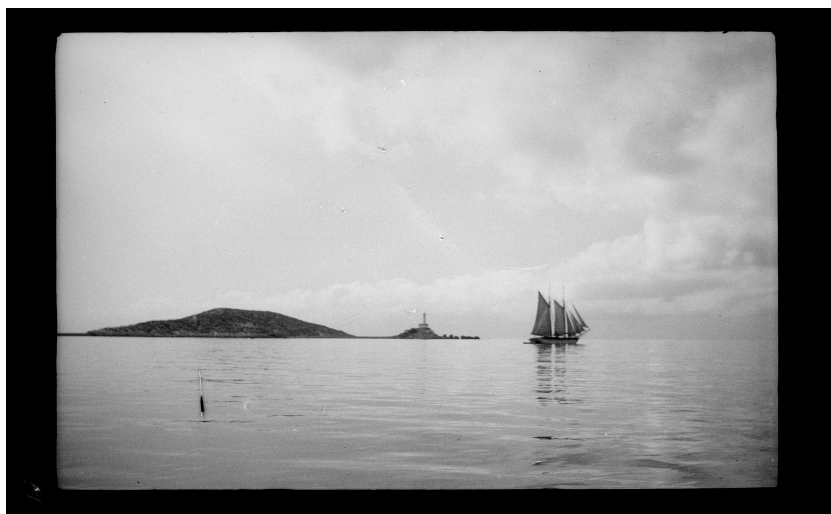
Raoul Hausmann, Paysage marin , 1933-1936