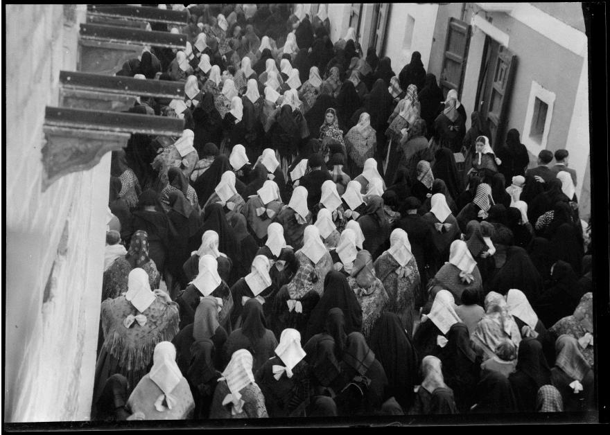
Raoul Hausmann, Procession à Sant Antoni de Portmany, 1934