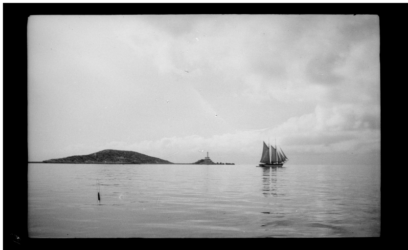
Raoul Hausmann, Paysage marin , 1933-1936