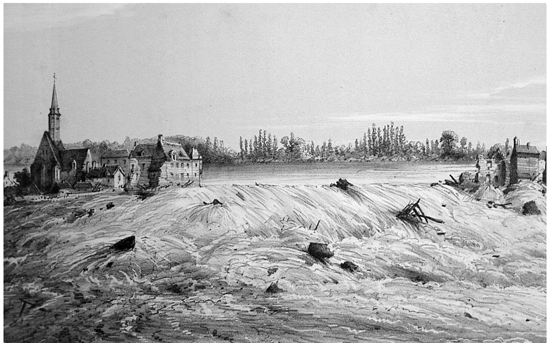
FIG. 3. 1866. Rupture de la digue du chemin de fer à Saint-Martin de la Place. L'illustration , 20 octobre 1866.