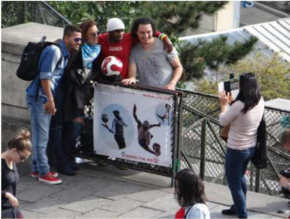
Figure 5 – Effusions entre touristes et migrants : la marge mobile devenue centre

l'intensité de ces relations comme le montrent les prises de vue réalisées. Par rapport aux modalités de sociabilité passive précédemment identifiées, sourires, selfies et applaudissements participent d'un renversement du rapport au corps où le contact tactile est ici recherché. L'affaire d'un instant, marge et centre tendent à se confondre au-delà des mots (figure 5).