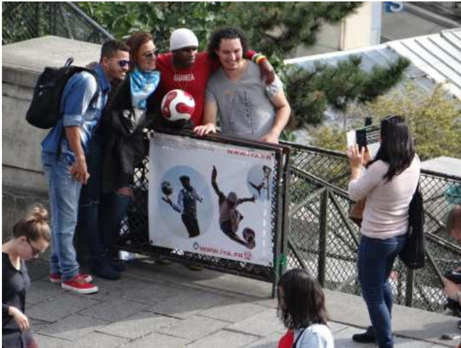
Figure 5 – Effusions entre touristes et migrants : la marge mobile devenue centre

l'intensité de ces relations comme le montrent les prises de vue réalisées. Par rapport aux modalités de sociabilité passive précédemment identifiées, sourires, selfies et applaudissements participent d'un renversement du rapport au corps où le contact tactile est ici recherché. L'affaire d'un instant, marge et centre tendent à se confondre au-delà des mots (figure 5).