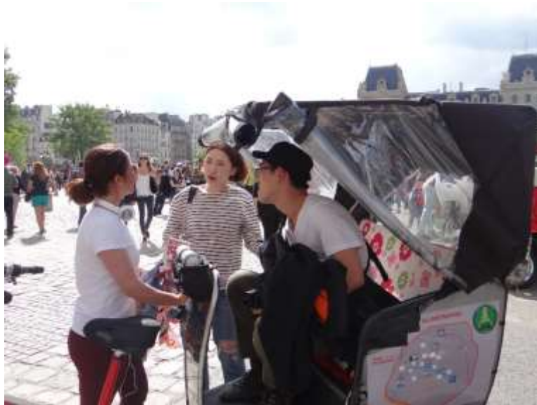
Figure 3 – Quand touristes et migrants négocient : une marge mobile plébiscitée

proximité car les commerces ayant pignon sur rue sont souvent situés à une distance non négligeable des flux touristiques, occasionnant une forme d'enclavement paradoxal des sites touristiques. Ces activités de la marge sont donc, bien davantage que le commerce formel, tout étroitement associées aux sites touristiques (figure 3). Pour certains touristes, ils sont partie intégrante des sites touristiques, voire en marquent les contours : « You know you are in touristy spots when you see them, they're close to what you want to see » (touriste de l'Ohio).