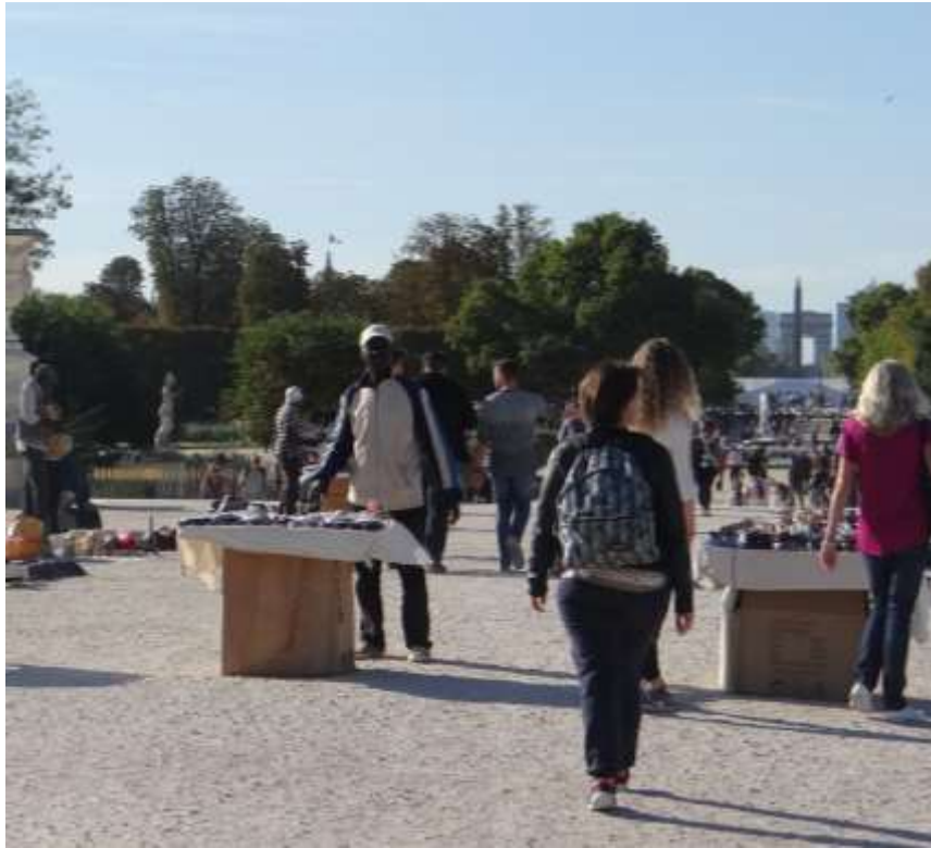
Figure 1 – Quand touristes et migrants s’entrecroisent : une marge mobile tolérée