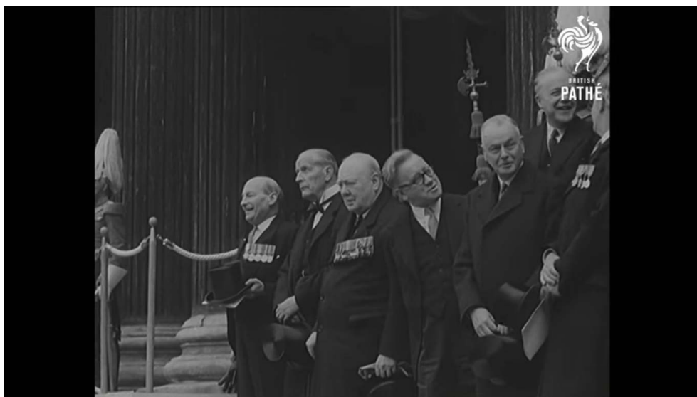
Figure 3. Cliché montrant Attlee, Churchill & Morrison sur les marches de St. Paul à la cérémonie d'ouverture