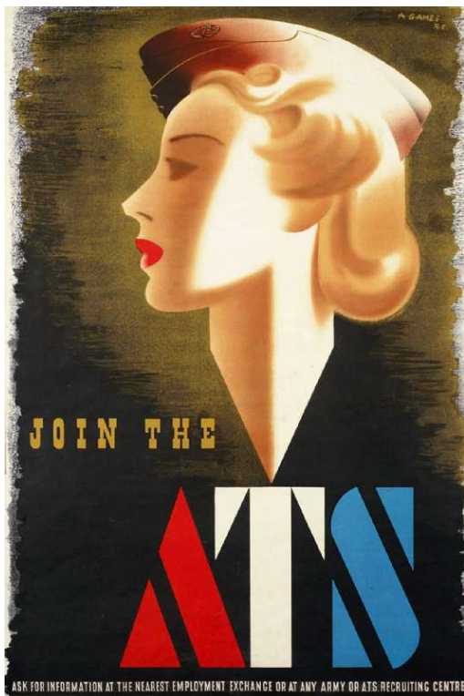
Figure 2. Abram Games, Join the ATS , 1941

instituteurs, a obtenu que l'affiche soit retirée cinq semaines après son apparition, avec un argument difficilement discutable : « Il faut que les femmes soient attirées dans l'armée par patriotisme, pas par goût du glamour 5 . »