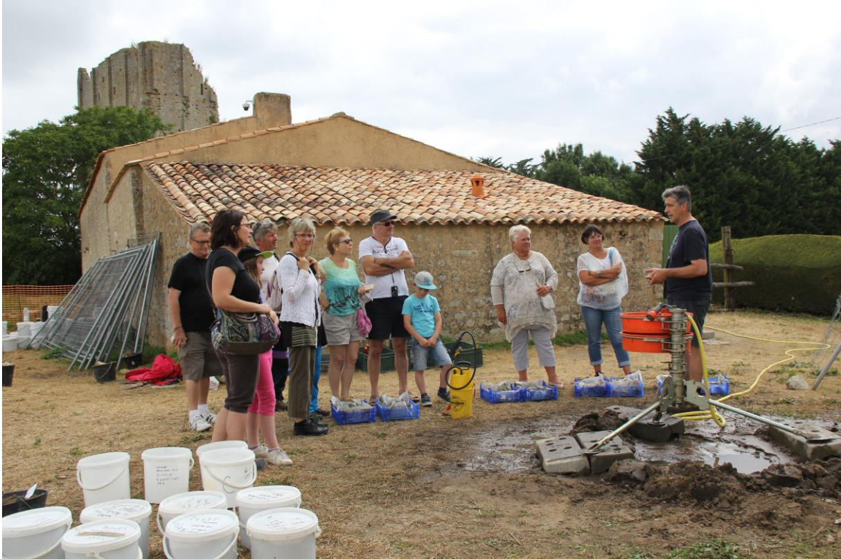
Station de tamisage sur le site castral de Broue (Charente-Maritime, XI-XVe siècle) en vue d'études archéozoologiques