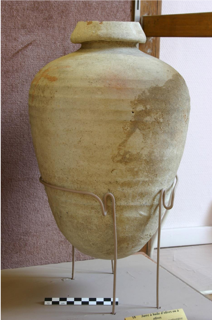
Cliché amphore : Amphore espagnole, époque moderne (La Rochelle, Musée d'Orbigny-Bernon)