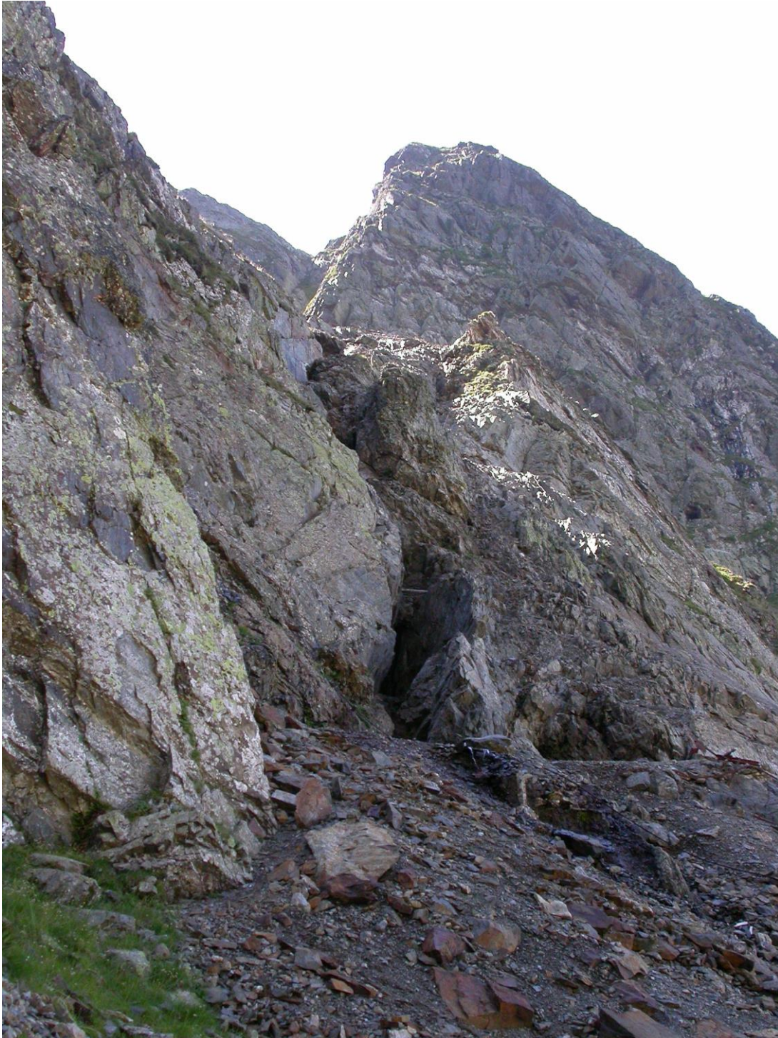
Chantier moderne sur l'affleurement d'un filon à zinc en vallée d'Ossau (64), (Cliché Argitxu Beyrie, Eric Kammenthaler)