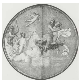
Tondo de la Volta Dorata (Esquilin). Image retouchée

L'aigle marchant reprend le répertoire symbolique romain ancien du guerrier, de l' impe-rium et de la victoire dont la première association à un divus est sans doute un as émis sous Tibère entre 34 et 37 2 : sur l'avvers, un portrait d'Auguste est accompagné de la mention DIVUS AUGUSTUS PATER , sur le revers un aigle déploie ses ailes dans une figuration proche des camées néroniennes (avec une différence notable car il tient la sphère céleste dans ses serres); si la monnaie évoque la consecratio d'Auguste, elle vise cependant surtout à légitimer le pouvoir de Tibère 3 .