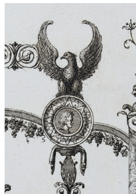
Gravures de Ludovico Mirri, Vestigia delle terme di Tito e loro interne pitture , Rome, 1776. Bibliothèques de Nancy. Cote 699 032.

Les apothéoses néroniennes naissent donc de la convergence de plusieurs courants iconographiques et symboliques. Elles sont une illustration de l'ambiance spirituelle et culturelle du moment et du succès du thème de l'apothéose dans la société de l'époque. Cependant, si elles ne relèvent ni du domaine public ni de l'art officiel, le statut de la personnalité qu'elles célèbrent et le répertoire typiquement romain de leur iconographie leur confèrent une spécificité impériale : elles constituent le premier jalon de la genèse séculaire de l'iconographie des divi .