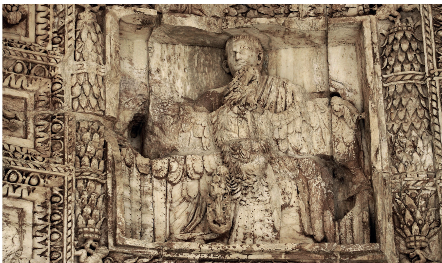
Apothéose de Titus sur la voûte de l'Arc de Titus, 81, Rome.

L'aigle de Titus, au demeurant assez grossier, s'inscrit dans leur filiation, mais innove dans deux domaines majeurs : en premier lieu, l'aigle ne marche plus, il s'envole et emporte Titus qui tient ses ailes des deux mains. En second lieu, la scène orne un édifice public et devient un thème officiel. Avec ce double changement se précise l'iconographie impériale de l'apothéose.