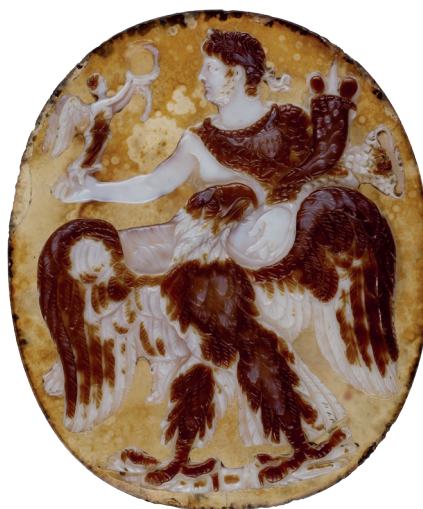
Camée de Néron