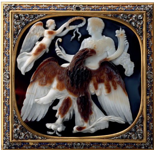
Camée de Claude