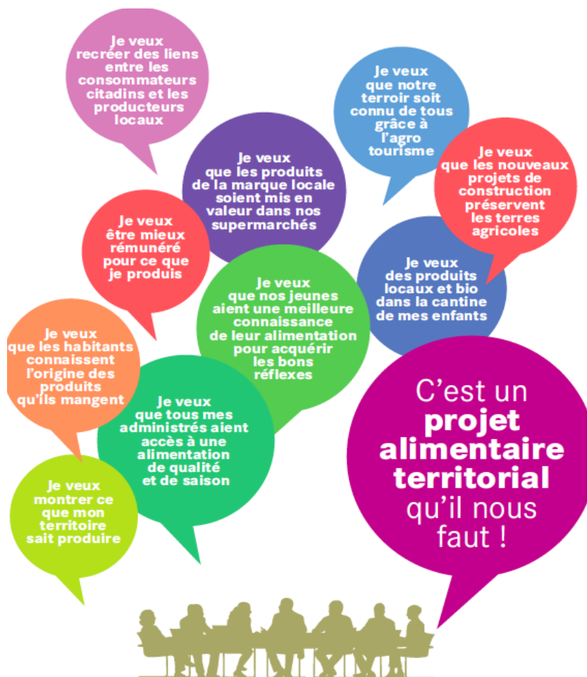
Figure 2 : les PAT, des projets de territoire aux multiples entrées alimentaires

cas à aller au plus simple sans toujours toucher au plus essentiel ou au plus englobant. C'est ainsi qu'on a pu voir des propositions se présentant comme PAT, qui visent simplement à assurer l'approvisionnement d'une cantine en produits locaux, ou l'ouverture d'un magasin de producteurs. Certains projets retenus au titre du PNA entretiennent donc l'ambiguïté quant à la nature de la dimension véritablement territoriale des PAT.