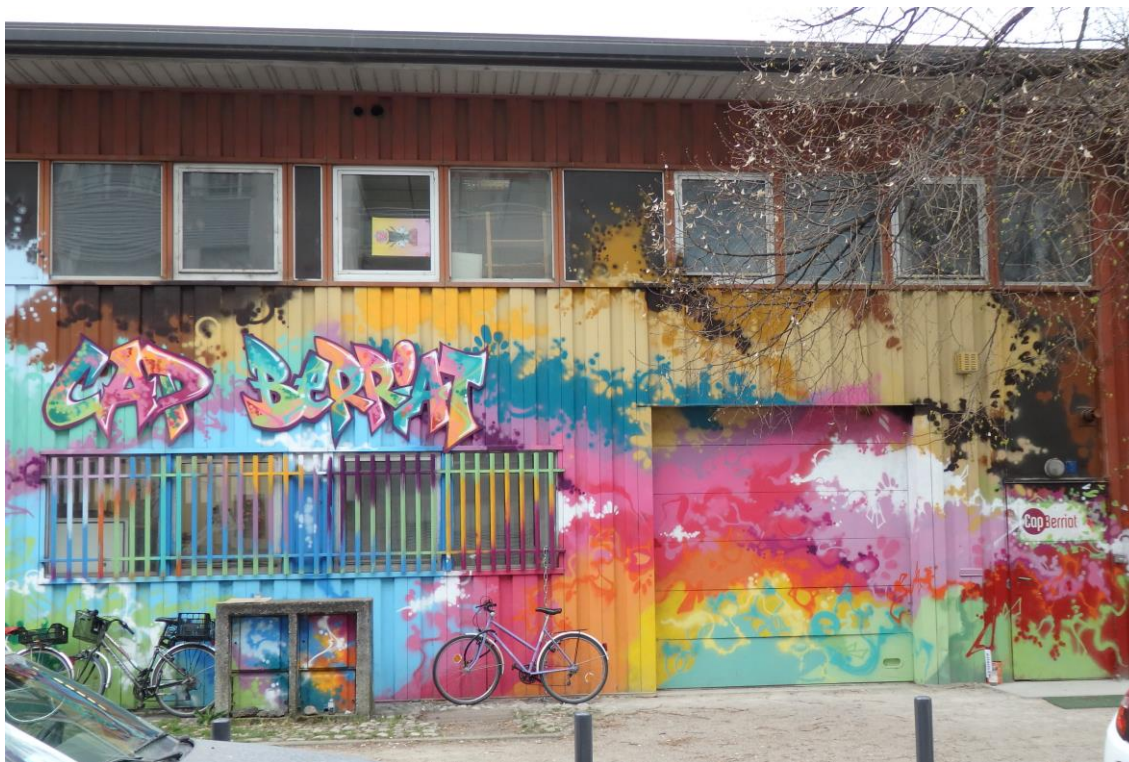
Cliché de B. Michel, 2016.

102 sous A. Carignon). Sous M. Destot, les collectifs comme le Brise-Glace bénéficient d'une écoute politique par le biais des adjoints à la culture et au développement économique. Au début des années 2000, la rénovation des derniers espaces de friche, combinée au changement d'adjoint à la culture suite à la réélection de M. Destot en 2001, rend plus difficile le maintien de ces collectifs à Berriat.