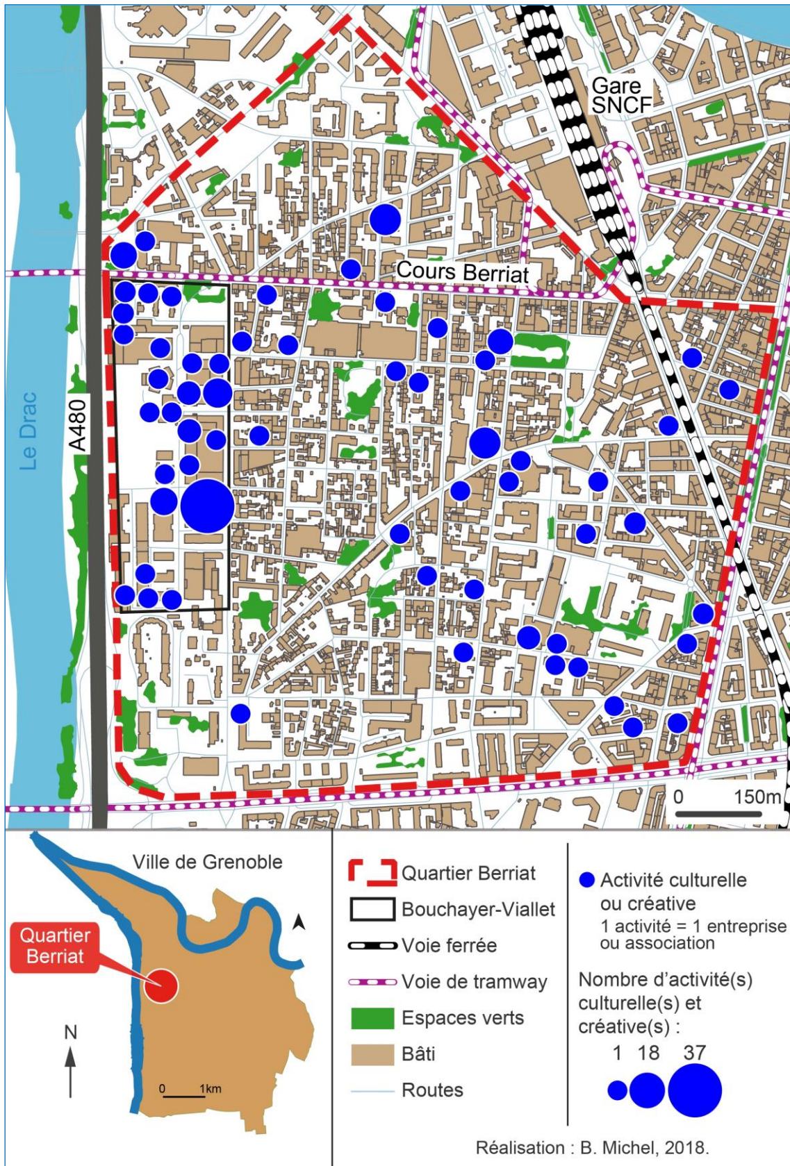
Fig. 1. Carte de localisation des activités culturelles et créatives du quartier Berriat