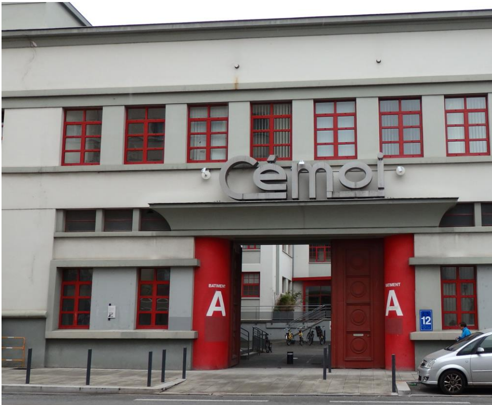
Cliché de B. Michel, 2016.