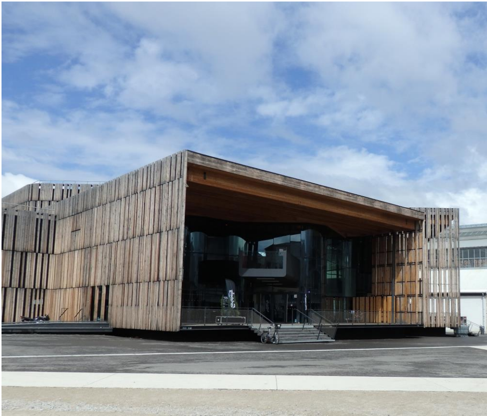
Cliché de B. Michel, 2016.