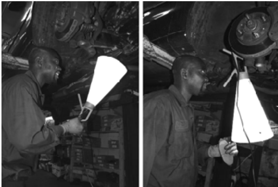
Lampe Mayday , Konstantin Grcic, 1999

La fin du XXème et le début du XXIème siècle ont vu apparaître une révolution technologique liée au réseau internet et au développement de la téléphonie mobile. Au même moment, des produits de design mettant en jeu la mobilité de l'usage et de la production des biens de consommation sont apparus. La lampe Mayday , de Konstantin Grcic, éditée en 1999, en est un exemple. Elle rassemble sous l'angle du jeu, quatre types de luminaires utilisables selon les contextes qu'offre l'existence. Dans Mayday , la résistance ne repose pas sur l'obstacle, mais sur le choix. Ce sont les choix de l'utilisateur qui déterminent la finalité et le contexte d'utilisation du produit. La résistance ici repose bien sur une discontinuité entre producteur et usage du produit. C'est l'utilisateur qui créera les liens entre usages possibles et usages réels du produit. A ce titre, il participera à la construction du sens du produit dans son environnement quotidien.