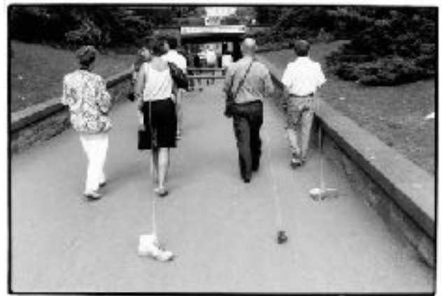
Fluids , Allan Kaprow, activité, 1967 Take a shoe for a walk , Allan Kaprow, activité, 1989

Tout produit de design, si innovant soit-il, est dans son usage, destiné à intégrer à plus ou moins long terme notre routine, c'est-à-dire un mode d'activité(s) mécanique(s), où l'attention se perd au profit de mille pensées. Dans ses activités centrées sur le quotidien, Kaprow est allé plus loin dans la recherche d'un art qui ne soit pas de l'art et dont la seule