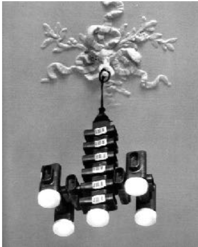
Lustre, série Objets ordinaires , 5.5 Designers, 2004

des sens, ni de saisir la signification des choses au moyen de la pensée» 21 . Les designers ont donc opté pour le jeu, afin de déplacer les objets connus dans un contexte nouveau, offrant ainsi un espace de liberté à l'utilisateur. Au travers des expériences proposées, nous trouvons des environnements connus ré-actualisés par l'expérience. Pour ce faire, les designers ont complexifié le rapport usuel à ces environnements. Ils ont donné une épaisseur de résistance à l'expérience. Les résistances, ici, induisent une contribution de l'utilisateur qui devient décisionnaire dans la forme et la finalité du produit. L'utilisateur s'approprie la part d'indécidabilité du projet et joue à actualiser le produit en rapport avec son environnement à chaque nouvel usage. C'est ainsi que l'activité se trouve sans cesse enrichie par le quotidien. L'activité, c'est-à-dire, la manifestation du pouvoir-agir de l'utilisateur s'exprime dans son environnement familier et participe en retour à accorder l'organisme au cours des choses. L'expérience comme enjeu du design faible révèle l'importance de l'activité produite dans l'usage, c'est dans le vécu de cette activité que peut se construire et se produire la contribution esthétique de l'utilisateur. Afin de mieux comprendre en quoi consiste cette contribution et comment elle apparaît dans l'activité, nous allons aborder le travail pratique et théorique d'Allan Kaprow.