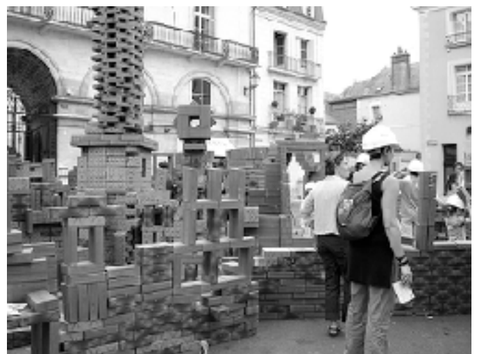
5.5 Designers, Apporter sa brique à l'édifice , Festival Rayon Frais , Tours, 2006

• modes non-reconnus dans un contexte non reconnu comme design (non-design pour un non-lieu du design). Les post-productions des bricoleurs amateurs sont un bon exemple de ce dernier cas. La plupart du temps ces objets passent inaperçus et ne sont pas exposés, ils sont simplement présents dans le cadre banal du quotidien. Le photographe Jérémie Edwards a cependant présenté quelques spécimen de ces produits