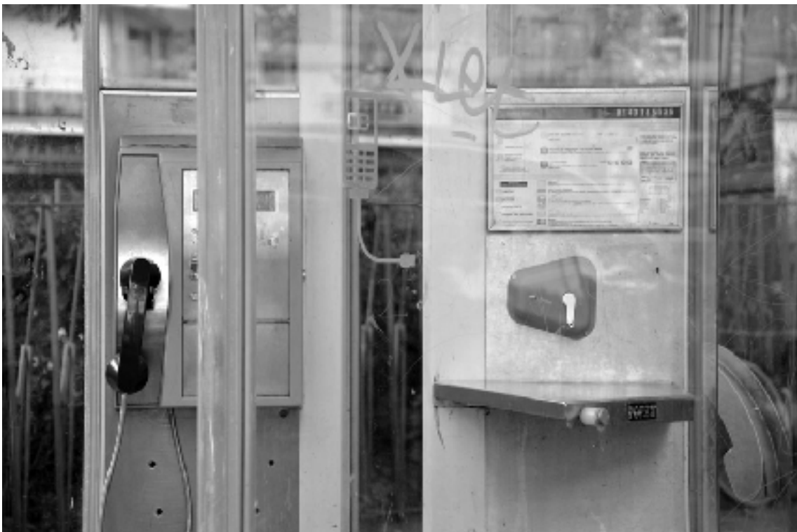
Fabrique Haktion (Pluvinage, Chassériaux, Bardin), Cabine électrique , impression 3D, 2010

Haktion interroge l'usage depuis la sphère des utilisateurs, elle emploie un mode reconnu de design pour critiquer et moduler l'espace public. Celui-ci est habituellement conçu de manière consensuelle pour servir au plus grand nombre, cependant qu'il gomme les particularités des quartiers et oublie de répondre à certains besoins réels du terrain. La Fabrique Haktion pallie les manques, «met à jour 11 » les produits issus de la grande industrie dont les cycles de vie ne suivent pas les évolutions rapides des usages. La transformation d'une cabine téléphonique obsolète en point servant à recharger son téléphone mobile, en est un bon exemple. Le recours à la couleur rouge fluorescent qui fait signe dans l'espace visuel neutralisé de l'espace public montre une volonté de rester visible comme procédé alternatif de production de services. Contrairement au produit standard, le produit fluorescent ne cherche pas à s'intégrer visuellement à son environnement, il reste une greffe , une hétérotopie , un lieu à part des conventions.