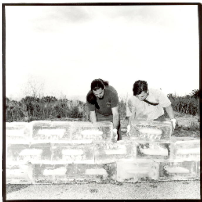
Allan Kaprow, Fluids , reproduit au centre culturel Angels Gate, Los Angeles, avril 2008

Nous allons revenir aux classifications de Kaprow, qui proposait en 1967 17 , une typologie intégrant les six grandes directions que, selon lui, le happening avait pris depuis son émergence dans le champ de l'art contemporain. Cette typologie a pour intérêt de faciliter l'identification des productions variées du happening et évite soit de réduire la pratique à une définition trop corsetée, soit d'aboutir à une définition trop floue pour être exploitable par les critiques et les théoriciens de l'art. C'est au travers de cette typologie que nous allons rendre compte d'une étude des exemples du design faible.