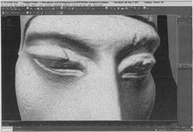
Figure 2: Restaurations virtuelles sur le buste numérique d'Akhenaton (Archéovision - Archéotransfert)