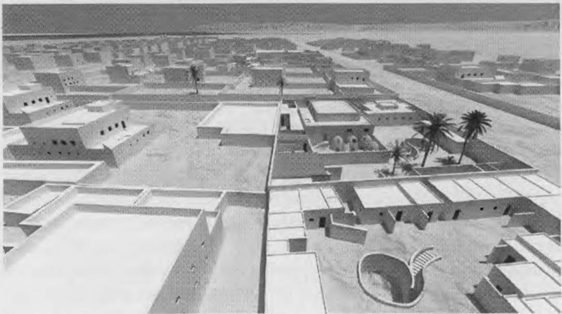
Figure 3: Version V2: Maison de Djehoutymes, aspects extérieurs (Archéovision - Archéotransfert -Musée de Genève).