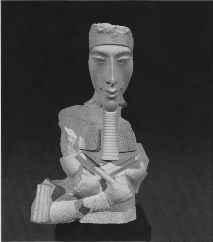
Figure 1: Version numérique (VO) du buste d'Akhenaton conservé au Louvre (Archéovision - Archéotransfert)

Robert Vergnieux 2004, Editeur scientifique en collaboration avec C. Delevoie des Actes du Colloque Virtual Retrospect 2003 , Collection Archéovision aux éditions Ausonius, (Bordeaux 2004).