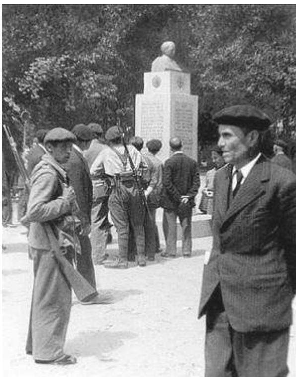
L'illustration , «La guerre civile d'Espagne», n° 4921, 26-06-1937.