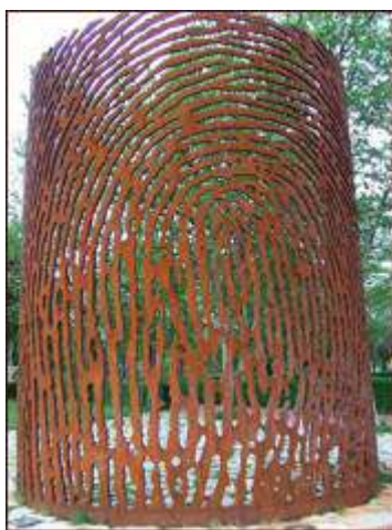
Fig. 10 Juanjo Novella, «La huella», (2006)