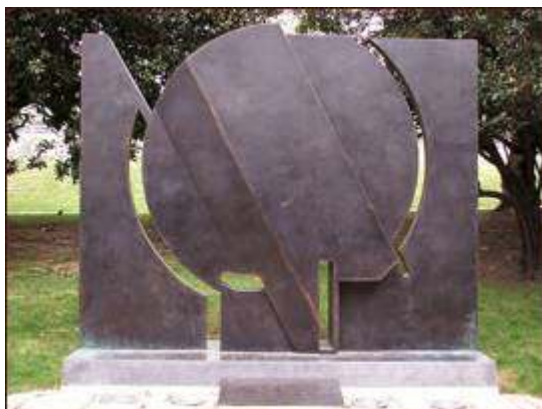
Fig. 9 Néstor Basterretxea, «Memoria viva» (2006)

la traducción del mismo realizada al euskera por Gabriel Aresti. Ambos textos fueron seleccionados expresamente para la ocasión por el escritor Bernardo Atxaga.