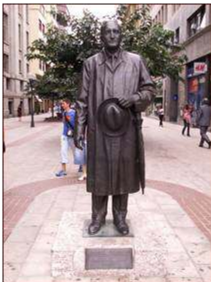
Fig. 8 Francisco López (2004)

colgado del brazo y sombrero en la mano. Se trata de una escultura hiperrealista, un tanto hierática, pero humanista al transformar al destacado dirigente político en un paseante más entre los bilbaínos.