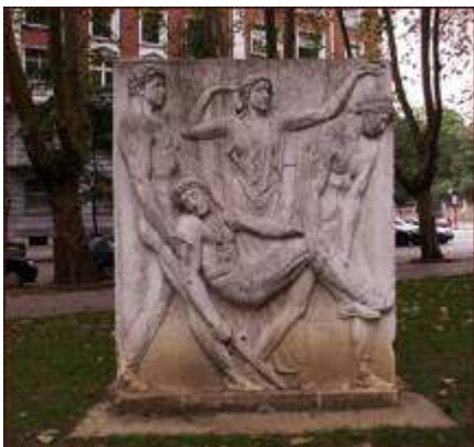
Fig. 6 Enrique Barros, Medio relieve exento que formaba parte del «Monumento a los Caídos», Bilbao (2009).