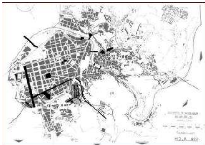
Fig. 2 La huella de la Guerra Civil en el callejero de Bilbao (1964)

entre 1963 y 1965 que recuperaban de nuevo destacados episodios de la mitología de la cruzada como los de «Nuestra Señora de la Cabeza», «Batalla de Brunete», y «Cuartel de la Montaña», y los nombres de las unidades de combate «Tercio Nuestra Señora del Camino» y «Tercio Nuestra Señora de Montserrat», reforzando así de manera considerable la presencia de la memoria de la guerra en esta parte de la ciudad.