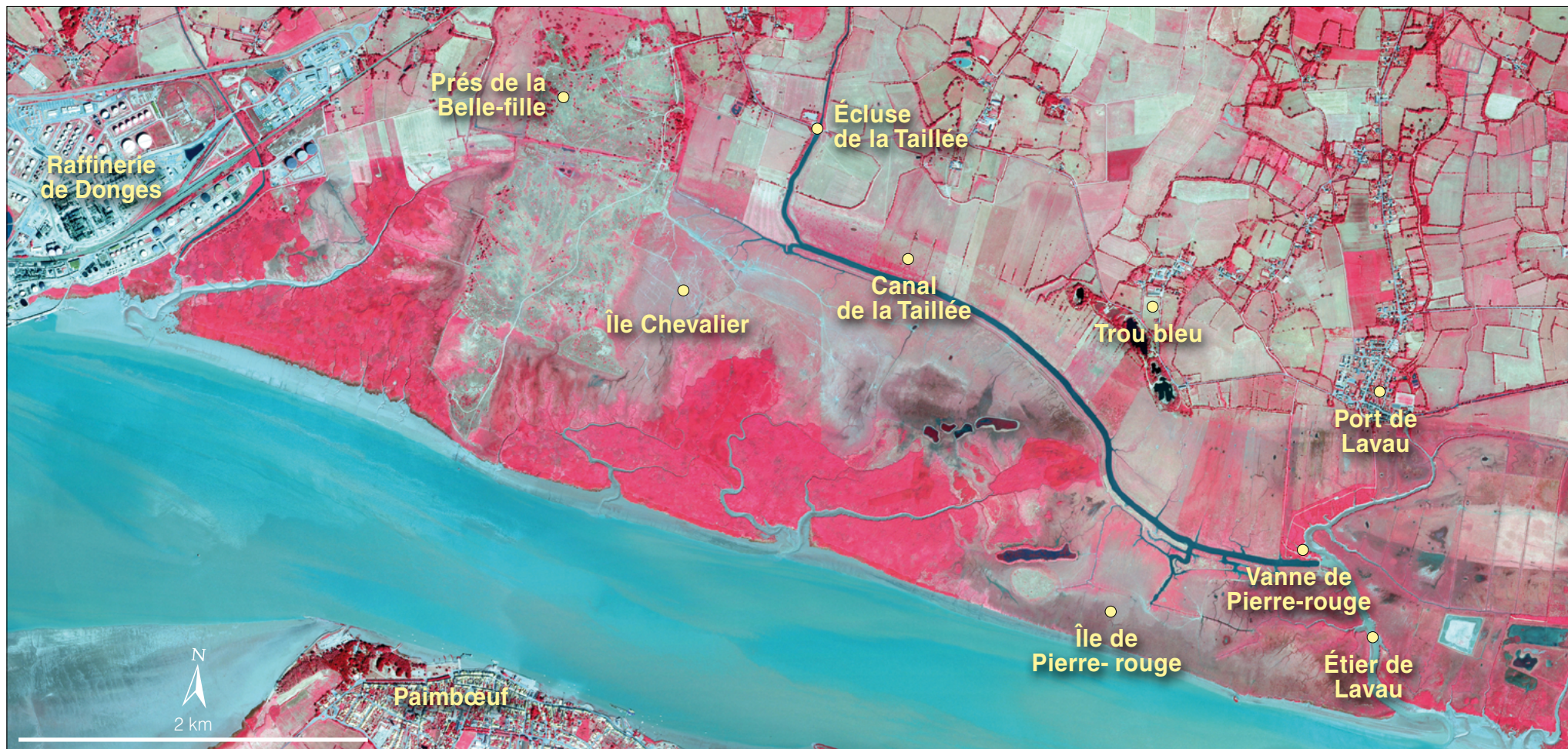
[1] Îles de Chevalier et de Pierre-Rouge en rive nord de l'estuaire de la Loire