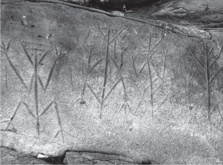
Fig. 6 – Gravures zoomorphes du pétroglyphe de La Carapa, près de Kourou, en Guyane française.

française 12 . Là, près de Kourou la spatiale, a été découvert il y a quelques années un énorme rocher gravé d'un long défilé de silhouettes filiformes très similaires (Figure 6). Les archéologues les ont définies comme des personnages (la queue dont sont munis la plupart d'entre eux est ainsi autoritairement éliminée du propos sans justification) représentant des symboles de fertilité, des monstres et des jumeaux primordiaux – les clichés ont la vie dure. Une vision bien différente de celle des chamanes kali'na qui y reconnaissaient clairement la marque de Paila-un-dupo , un être dangereux qui aurait dessiné dans la roche les personnes qu'il avait dévorées afin de comptabiliser ses victimes. Deux lectures opposées d'un même site car fondées sur des référents et des savoirs de mondes séparés. Le chemin sera donc encore long pour concilier la conviction du chercheur et la foi du chamane. En tout cas, Dimitri Karadimas aura été un contributeur précieux de ce rapprochement.