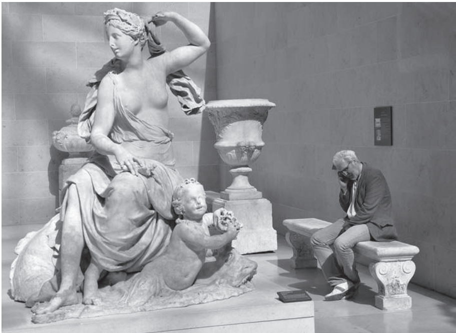
Fig. 7 – Dimitri Karadimas au Louvre, avec la déesse de la mer Amphitrite, Paris, 2016.

À travers une pensée structuraliste, Dimitri Karadimas a proposé un regard sur l'iconographie amérindienne libéré du prisme eschatologique européen, ouvrant par là même sur un univers insoupçonné, où règnent insectes, constellations et mutations. Il a dévoilé cette Amérique des contraires, en mettant à nu ce qui apparaissait à beaucoup comme de la sauvagerie, pour mieux affirmer une délicate subtilité anthropologique (Figure 7). Ce faisant, il est entré par la grande porte dans le panthéon des penseurs fondamentaux de l'histoire humaine de l'Amérique latine.