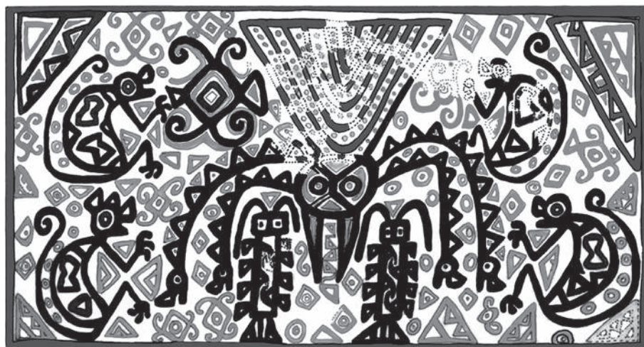
Fig. 2 – Guêpe parasitoïde déposant ses œufs dans une mygale et tissu représentant une guêpe pompile entourée de quatre singes, avatars de mygales et victimes du parasitage de l'insecte, culture Huari, côte centrale du Pérou, 650-800 apr. J.-C. (d'après Karadimas 2007a).