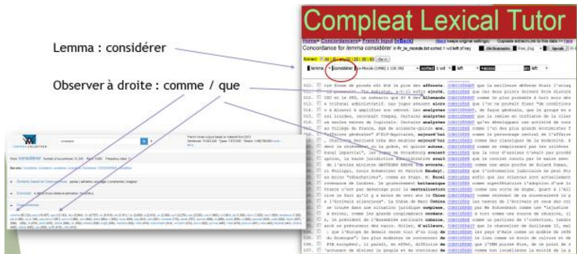
Copie d'écran 3 : Comparaison du lemme « considérer » dans Lextutor et Le Corpus Français de Leipzig

l'étudiant peut lire et trier les extractions. Nous les encourageons alors à comparer les résultats des corpus comme dans l'exemple ci-dessous :