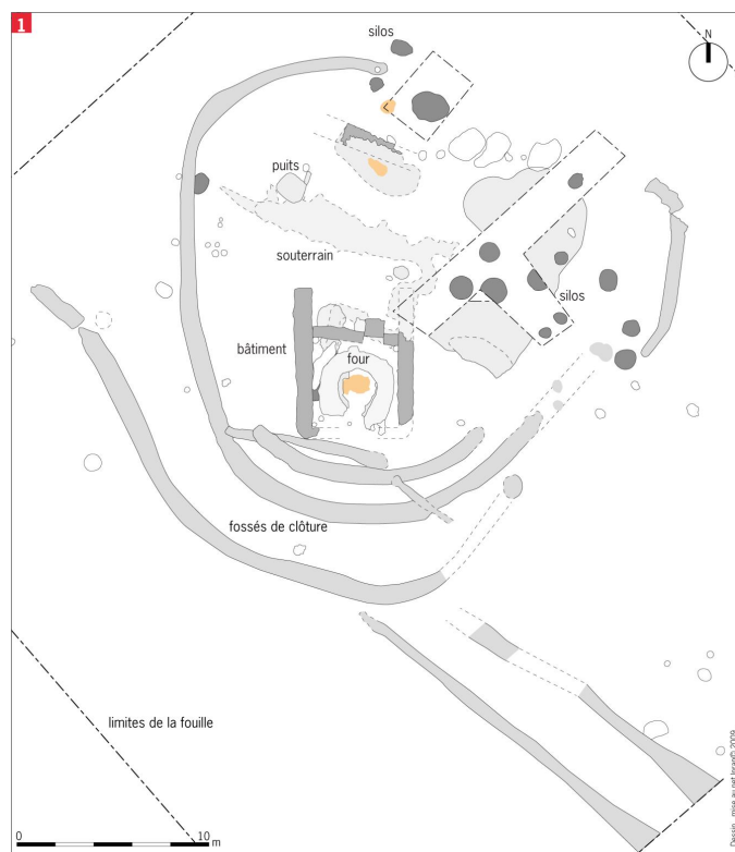
Fig.1 Plan des structures de Saint-Projet Saint-Constant