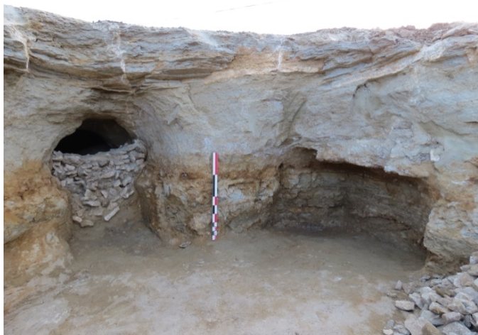
Fig. 6 Galerie fermée par un muret

Au sud de l'emprise, partie occupée autour de l'an 1000 (X e - XI e s.), un souterrain, percé à travers le substrat cénomaniens très friable et fragile et dont le plafond a disparu, a également fait l'objet d'une fouille dans son intégralité. Il est constitué d'une galerie donnant accès à des alcôves et une petite salle. Lors d'une seconde phase, un mur bâti en pierres sèches barrant le tiers inférieur de la galerie a été construit (Fig. 6). Cet aménagement peut être interprété comme une structure de défense