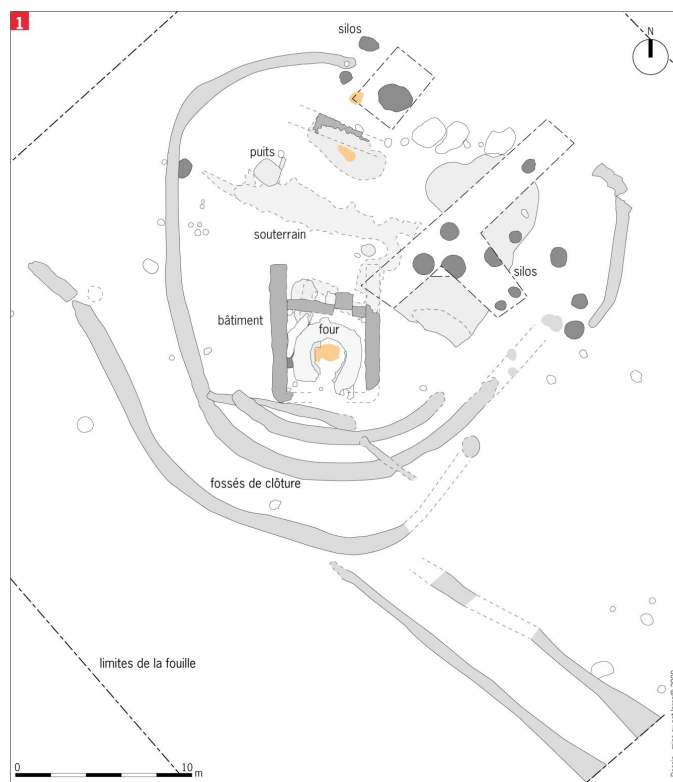
Fig.1 Plan des structures de Saint-Projet Saint-Constant