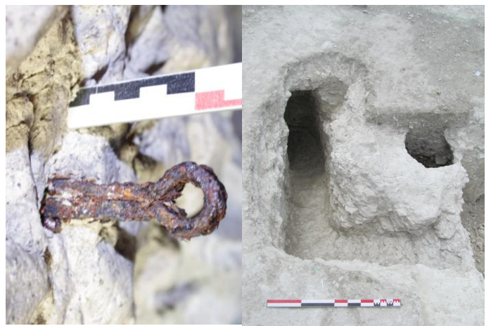
Fig. 5 Vestiges des souterrains de la Baube

Marigny-Brizay (86) (2012, RO : G. Bonnamour, Arkemine SARL)