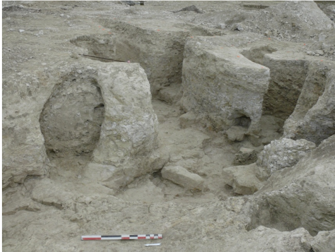
Fig. 4 Souterrains des Huillers

Entre le XI e et le XIII e siècle, l'occupation du site des Huillers s'organise au sein d'un enclos qui a subi de nombreuses transformations. Cet enclos protège d'une part les accès aux souterrains (Fig. 4) et d'autre part un ensemble de fosses et de silos qui sont concentrés, pour la plupart, au sud. Un total de 11 silos se trouve à cet endroit et on peut imaginer qu'ils fonctionnaient en même temps que les souterrains. Cependant, peu de relations stratigraphiques nous permettent de déterminer le phasage exact de ces structures.