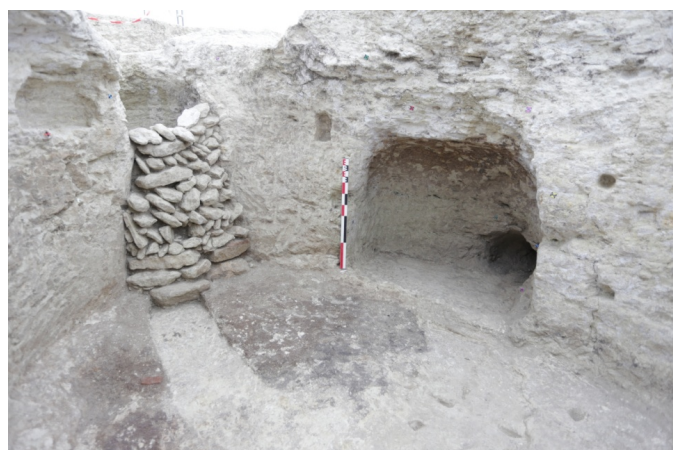
Fig. 8 Salle semi-excavée et accès au souterrain de Marigny-Marmande

Le complexe souterrain est, lui aussi, largement appréciable en raison de sa bonne conservation. Elle a permis d'observer divers aménagements taillés dans le calcaire dont un escalier d'accès, un puits de creusement, des niches à lampe, des encoches de fermeture dans le couloir, des feuillures, des trous de piquets et une banquette. L'ensemble des aménagements découverts offre la possibilité de retracer l'histoire du creusement et de l'occupation de ce souterrain. Une galerie dont l'accès se faisait depuis la salle semi-excavée donne dans une salle voûtée de plan triangulaire. Celle-ci ouvre sur une galerie qui donne accès à une salle. Dotée d'une banquette et de plusieurs aménagements en trous de piquets, elle communique avec la surface par un escalier, ainsi qu'avec une salle refuge protégée par un ensemble de deux chatières successives. On signalera que le creusement de la galerie se trouvant entre ces dernières a été réalisé à partir d'un couloir muré dans un second temps.