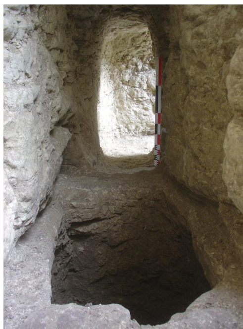
Fig. 3 Souterrain de La boutelaye, «silo-piège»

Occupé du XI e au XIV e siècles, l'habitat médiéval du site de la Boutelaye s'organise à l'intérieur d'un enclos réaménagé plusieurs fois au cours de son utilisation. En surface, quelques structures de stockage s'organisent en aire d'ensilage. Lors d'une phase de réaménagement de l'enclos, des couloirs et des escaliers ont été aménagés depuis la surface afin d'accéder à des salles et galeries souterraines. Aménagés en plusieurs phases, des couloirs d'accès avec de multiples escaliers permettent d'accéder à des espaces semi-enterrés et souterrains. Une des galeries conduit à une salle (découverte effondrée au moment de l'intervention) accessible par une chatière. Des alcôves et banquettes se répartissent le long des couloirs et des salles tandis qu'un « silo-piège » a été creusé dans l'une des galeries (Fig. 3). Hormis les structures d'aération installées dans les puits semblables à ceux découverts sur le site de l'Ecusseau, des conduits tubulaires sont creusés à travers le substrat calcaire jusqu'à la surface pour aérer l'une des salles. De faible développement, ce souterrain intègre les