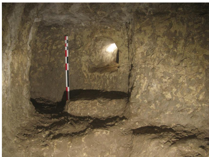
Fig. 2 L'écusseau, salle avec chatière

L'opération archéologique a permis de poursuivre l'étude d'un vaste souterrain qui avait déjà fait l'objet d'une exploration préliminaire lors de sa découverte à la fin des années 1990 (Triolet, 2003). Un second ensemble souterrain a été découvert lors de la fouille du site. Étagés, les vestiges souterrains dessinent de multiples ramifications présentant des architectures variées, parfois au caractère défensif, et une chronologie complexe. Deux accès prennent la forme de couloirs avec des escaliers, un autre se présente sous la forme d'une cave, sorte de sas d'accès à différentes parties souterraines. Des goulots ou chatières démontrent