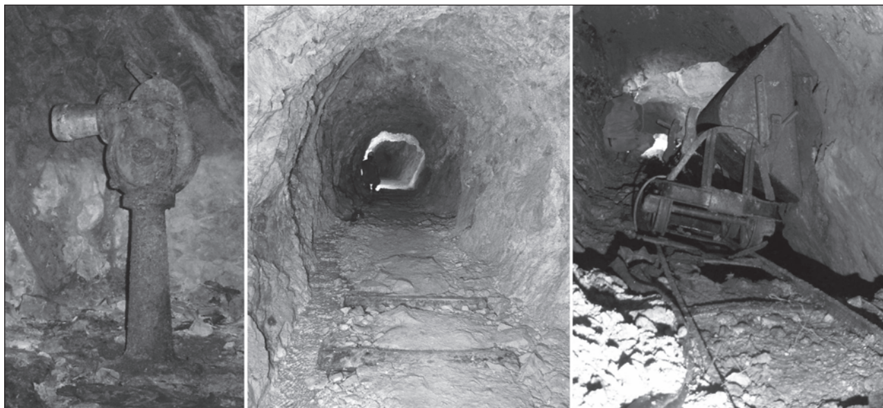
Fig 2 : A gauche, ventilateur manuel dans une galerie d'exploration à Joux (69) (xx e siècle). Au milieu, traverses en bois conservés dans le ballaste d'une galerie de la mine de Propières (69) (xix e et xx e siècle). A droite, Wagonnet conservé dans un chantier de la mine Lantignié (69) (xx e s.).

tion notamment marquée par l'utilisation de machines à vapeur pour actionner les machines d'extraction et d'exhaure, mais également pour les machines de minéralurgie. Les contraintes liées à l'exhaure des ouvrages souterrains qui s'approfondissent à l'aplomb des filons rendent les entreprises difficiles et onéreuses ce qui entraîne les abandons.