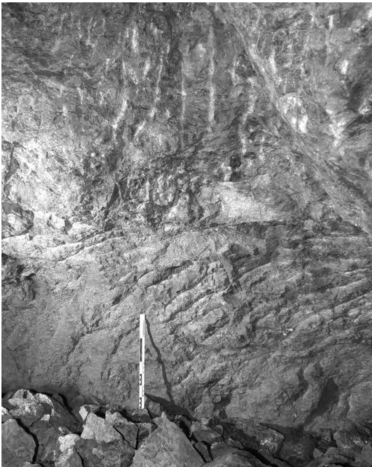
Fig 3 : Traces d'outils caractéristiques de l'abattage à la pointerolle (Joux, 69).

poraine ont depuis été reconnus ou retrouvés, par exemple dans le cadre des travaux autoroutiers de l'A89 (Boucharlat, Bailly-Maitre, Dumoulin 2013, p.93). Ces dernières années, des campagnes de relevés et de sondages archéologiques ont été effectuées sur deux des sites miniers se trouvant à Joux.