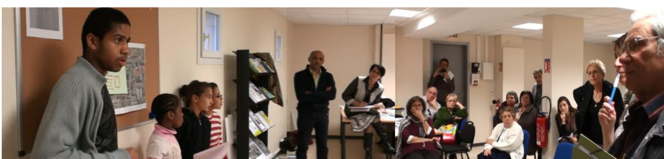
Présentation des enfants dans la 3 ème réunion de concertation du projet Carnot-Parmentier, le 04 avril 2011, pendant l'activité périscolaire Petits Architectes de la ville.