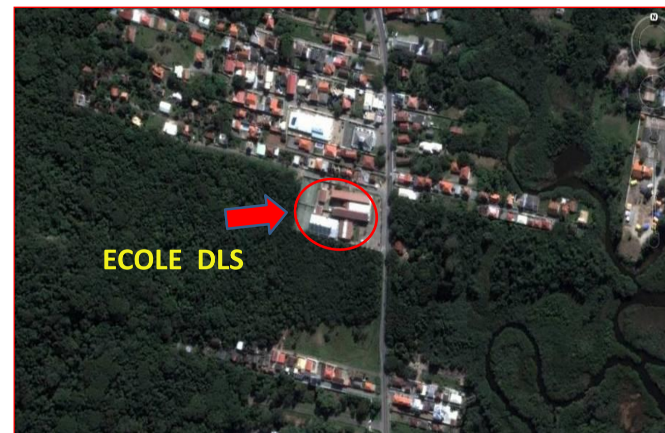
Le projet de l'École prévoit aussi la construction de passerelles et de sentiers entre différents écosystèmes permettant des études sur site ainsi que du tourisme écologique.