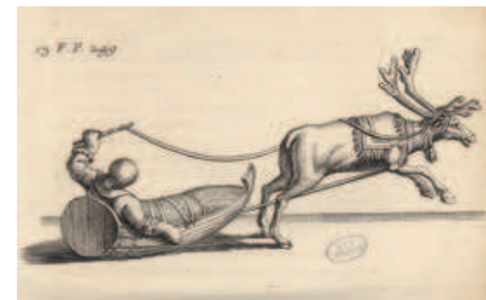
Renne et traîneau (illustration tirée de l' Histoire de la Laponie de Scheffer (Paris, 1678 ; coll. BNU)