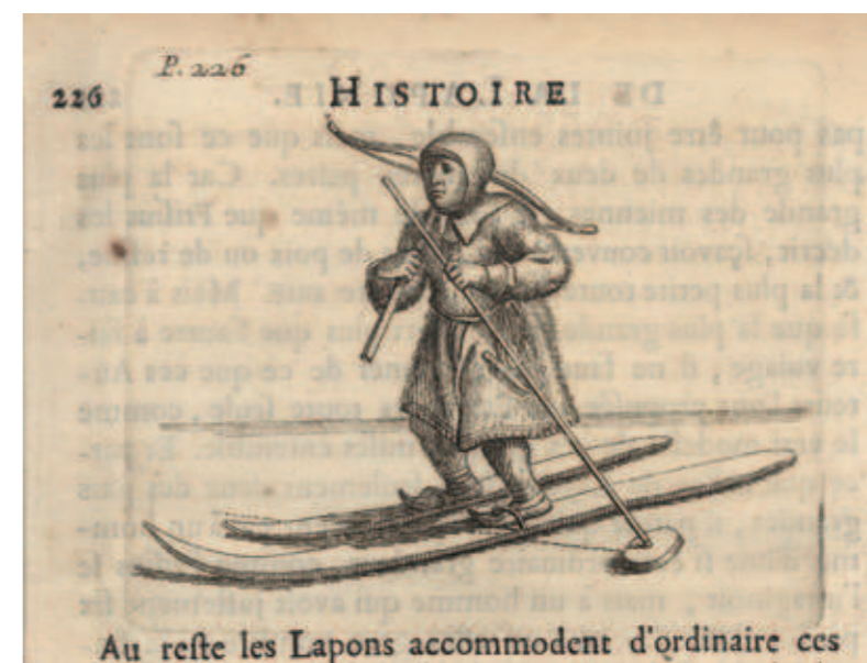
Un homme à ski (illustration tirée de l' Histoire de la Laponie de Scheffer (Paris, 1678 ; coll. BNU)