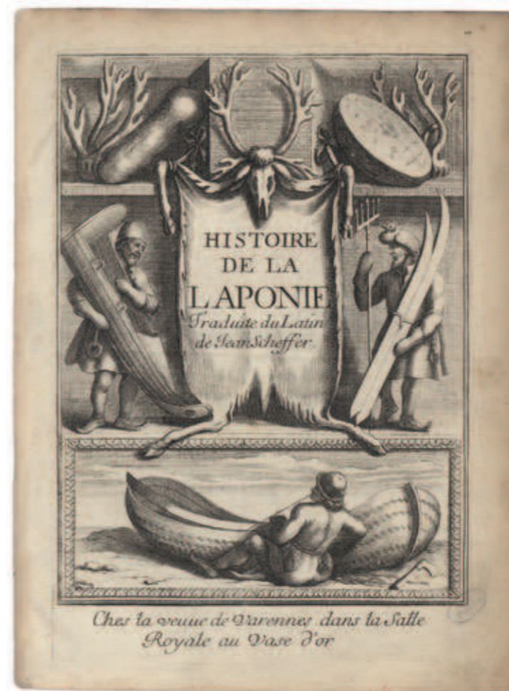
Avant-titre de l'édition française de l' Histoire de la Laponie de Scheffer (Paris, 1678 ;)

Cet inconvénient se transforme tout de suite en avantage : il peut utiliser sa méthode, formée aux sources classiques, à la description de la Laponie. D'abord, il fait un inventaire de toutes les sources écrites qu'il peut trouver, c'est-à-dire des sources anciennes, celles du moyen-âge scandinave, mais aussi des rapports et des relations des prêtres qui travaillent en Laponie. Ces rapports avaient été demandés par De la Gardie auparavant. De plus, il rencontre des étudiants venant de la région, avec lesquels il ne mène apparemment pas des entretiens à proprement parler, mais à qui il demande de rédiger des textes. Ces derniers vont être utilisés de la même façon que les autres textes écrits.