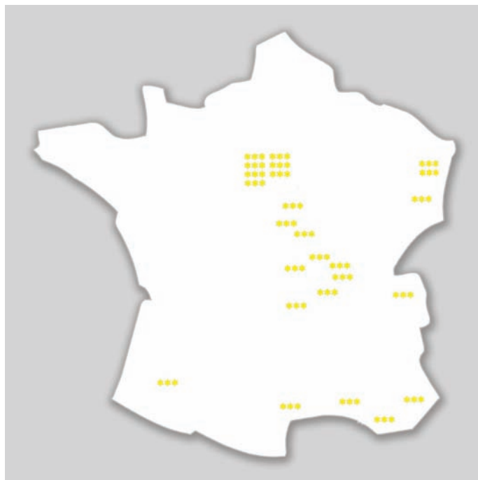
Fig. 4 : Restaurateurs étoilés Michelin entre 1988-1998

De 1988 à 1998 (fig. 4), la Bourgogne concurrence largement le Lyonnais quant à la représentativité gastronomique sur l'axe RN 7. On trouve ainsi 7 restaurants 3 étoiles à Paris, 7 restaurants 3 étoiles en Bourgogne, 3 restaurants 3 étoiles sur la Côte d'Azur, et 7 restaurants 3 étoiles hors RN 7.