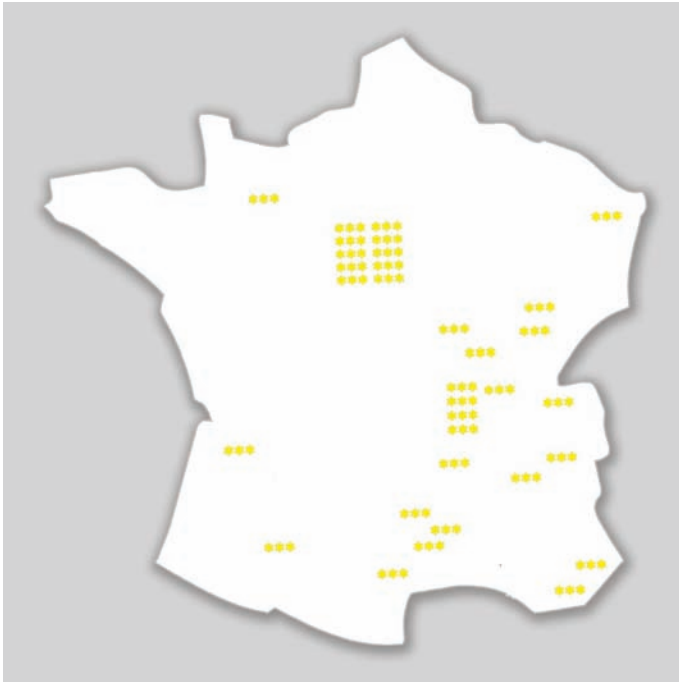
Fig. 1 : Restaurateurs étoilés Michelin entre 1935-1939