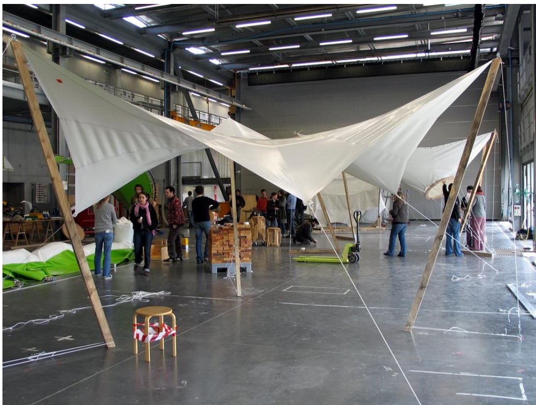
Fig. 2 Pendant plusieurs années, il a été possible, qu'un groupe d'élève en master de l'ENSA de Lyon collabore avec ceux de Montpellier sur la thématique des membranes. N. Pauli organisait l'atelier en plusieurs étapes : apports théoriques, conception en modèle réduit et réalisation. Les étudiants testaient diverses techniques, matériaux, détails de mise en œuvre, techniques de modélisation en maquette et réalisation à plus grande échelle. C'est cette liberté ouverte dans les programmes de chaque école au début des Gaïa qui a aussi contribué à leur richesse et développement.