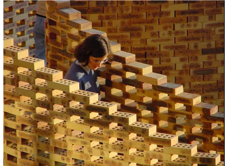
Fig. 12- et 13 : Bâtir... Habiter

Pour les architectes, la technique est à aborder aussi de manière globale, dans toutes ses dimensions: d'engagement, de contact avec la matière, en relation à l'autre , dans le temps de l'expérience... Cette " rencontre vivante " au sens de Tim Ingold 27 est probablement une des vraies ressources du vivre à condition de ne pas la réduire à une posture seulement "scientiste" ou "beaux-arts". L'acte de bâtir, l'art d'aménager l'espace, indissociables de l'habiter, engagent toutes nos dimensions humaines en même temps : corporelle, affective, intellectuelle, spirituelle... Il ne peut être entendu sans la dimension poétique dont parle Hölderlin 28 ou sans cette " mise en tension " propre à " redensifier le vivre " qu'évoque F. Jullien 29 Les architectes n'ont-ils pas vocation avant tout de devenir des bâtisseurs ? Dans le contexte contemporain d'architectures écoresponsables, les " pédagogies expérientielles " qui se déroulent aux GAIA ne sont-elles pas les plus cohérentes pour la formation des architectes? J'en suis intimement convaincu !