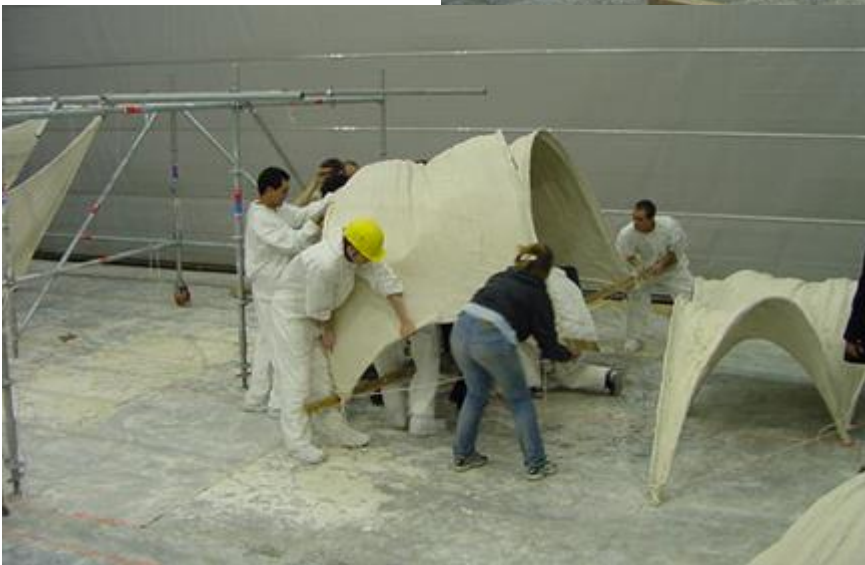
Fig. 9, 10 et 11: Structures en "coque" réalisées en stuc (de plâtre) et prêtes à être testées. Ces recherches et expérimentations avaient fait l'objet d'une importante préparation (et formation) avec la collaboration d'une entreprise de staff et stuc de Vaulx-en-Velin. (SARL Marquez)