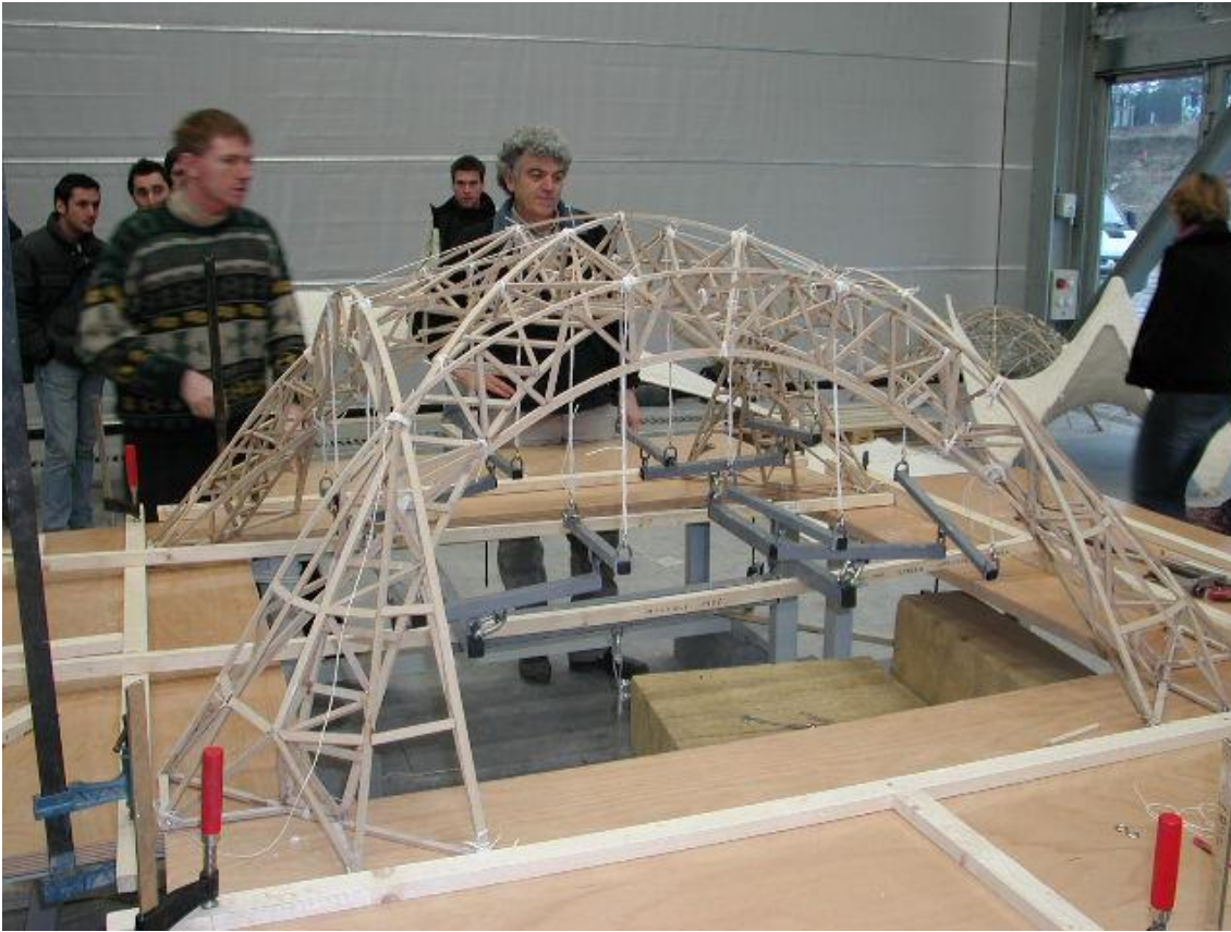
Fig. 6: Le bon angle de vue de cette photo permet de comprendre le banc d'expérimentation et le système d'accroche en 16 points à la maquette. En parallèle à cet exercice, d'autres équipes réalisaient des structures encore plus grandes (en barres et nœuds ou des coques en staff).

comportement à la rupture sous chargement réparti 9 d'un espace qui couvrait une surface 1,40 x 1.40 m, les étudiants concevaient, réalisaient et testaient une structure - initialement avec une logique de barres et nœuds -, ensuite avec des coques minces 10 . C'est un exercice représentatif de ce qui peut être fait dans l'environnement de la halle des Grands Ateliers, avec finalement très peu de moyens. Cet exercice de synthèse permettait d'articuler et faisait converger les connaissances théoriques enseignées dans chacune des "disciplines" - géométrie, morphologie, structure, construction, etc.- tout en conservant un aspect ludique.