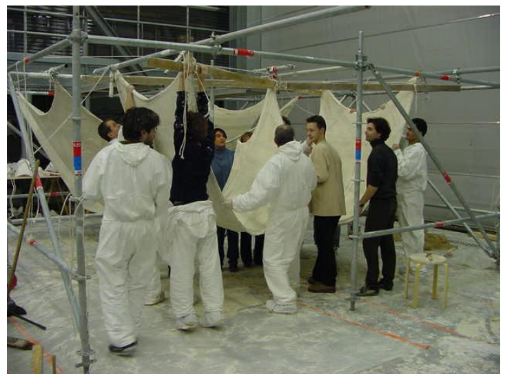
Fig. 7 et 8: En parallèle à l'exercice précédent (en bois), d'autres équipes réalisaient de plus grandes structures : en barres et nœuds avec tasseaux bois et connecteurs métalliques (photo 7) ou des coques en staff (photo 8).