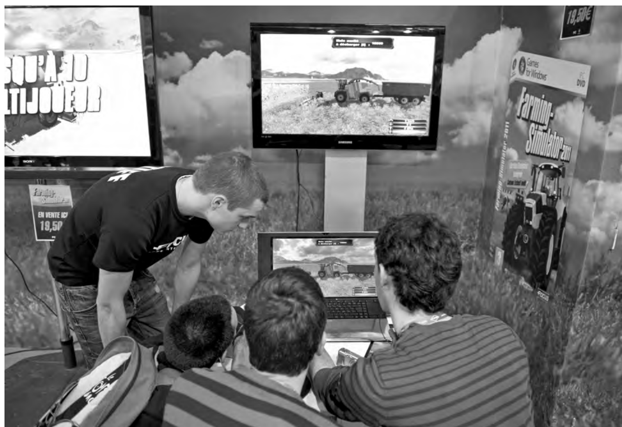
« L'avènement de l'informatique dans les années 1990 a orienté les recherches portant sur le renouvellement du pilotage des exploitations agricoles (logiciels, systèmes informatisés d'aide à la décision ...) et leur analyse ». Jeu vidéo permettant de simuler la gestion d'une exploitation agricole, Salon de l'Agriculture, Paris, mars 2011.

La troisième classe s'intitule « Dynamique des espaces ruraux ». Comptant 103 références, elle rassemble des travaux touchant au rural et étudiant plus particulièrement la dynamique des espaces ruraux. C'est