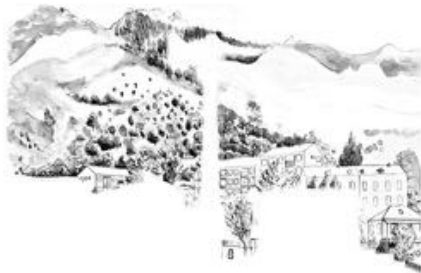
FIGURE 21 : Palinopsies . Série de photographies sur PVC, 60 x 50 cm, 2012.