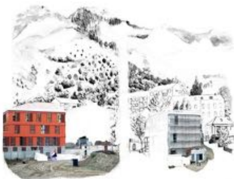
FIGURE 16 : Palinopsies . Série de photographies sur PVC, 60 x 50 cm, 2012.