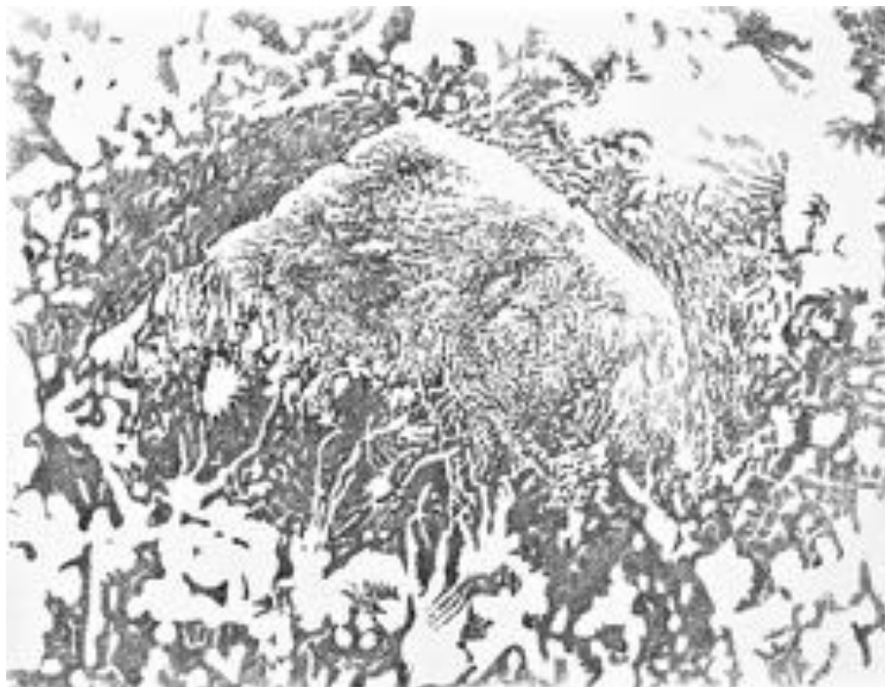
FIGURE 6 : “ Heady Roots ” - Polyptyque . Dessin à l’encre de Chine sur papier, 65 x 50 cm, 2016.