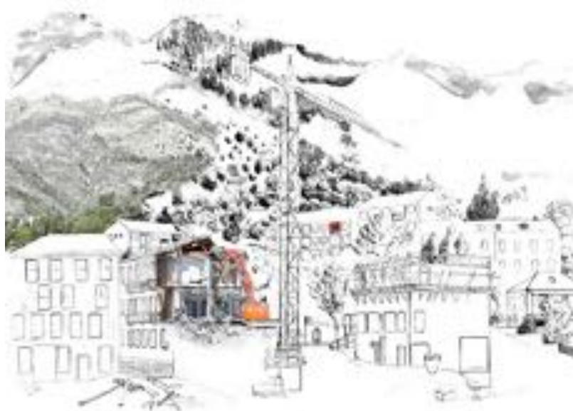
FIGURE 14 : Palinopsies . Série de photographies sur PVC, 60 x 50 cm, 2012.