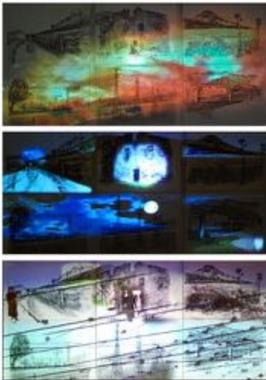
FIGURE 9 : Lignes d'erre II . Projections vidéographiques sur 6 lavis de 65 x 50 soit 200 x 100 cm, 2012.