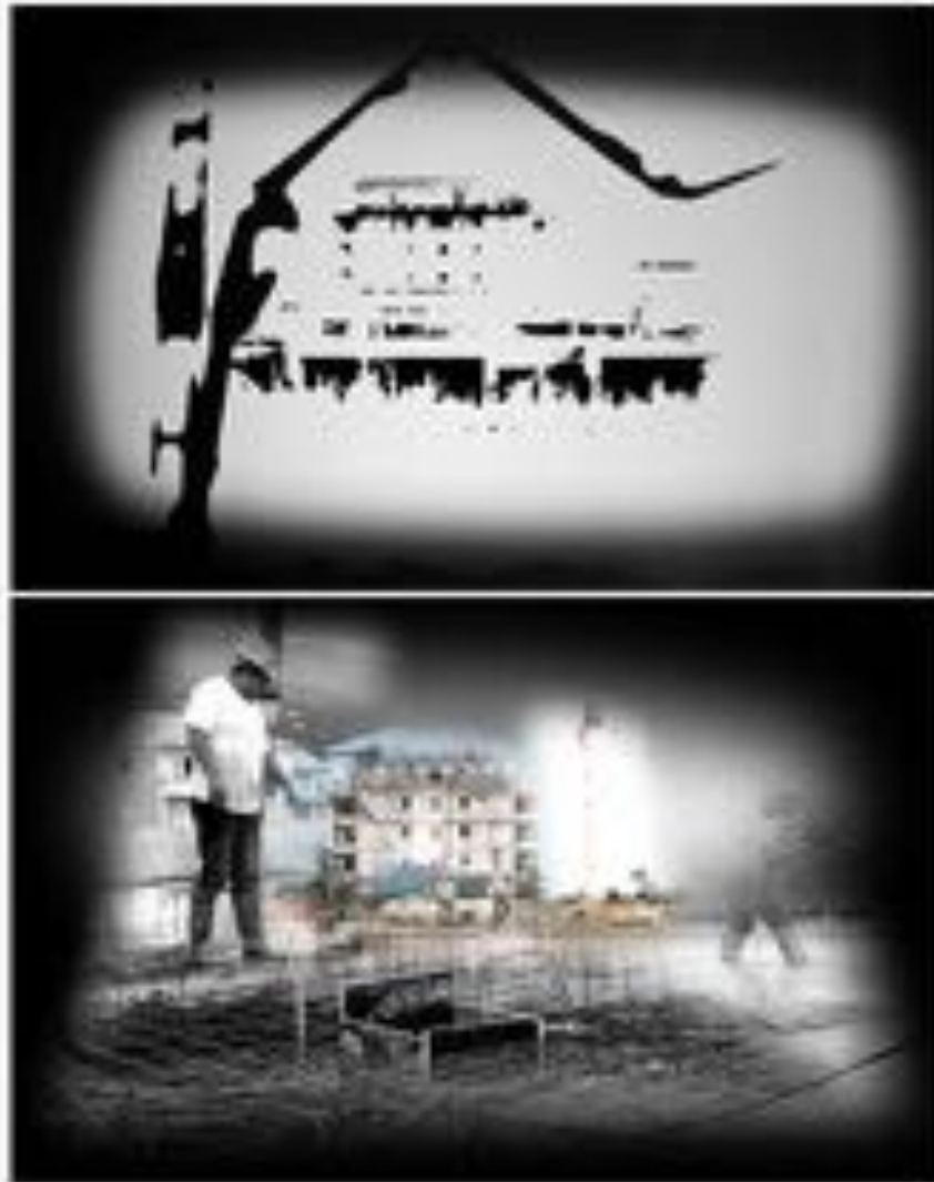
FIGURE 10 : Shifting Walls . Installation sonore vidéo & peinture sur mur, 290 x 170 cm, 10 minutes, 2017. Captures vidéographiques de l'installation.