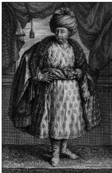
Tavernier en oriental. Portrait paru dans Les Six Voyages de Jean-Baptiste Tavernier (1679), gravure par Joan Hainzelman

des droits et des libertés, mais finance également la construction d'églises et de cathédrales lors de leur installation et participe à leur intégration au maillage social de la capitale 7 . À diverses occasions, il prend part aux cérémonies de Noël et de Pâques 8 , et partage un repas à l'improviste avec ses sujets chrétiens ou avec les représentants des souverains étrangers 9 . Cette impression de liberté relative ménagée par le pouvoir fut encore renforcée par le dialogue fréquent entre les diverses confessions. La Boullaye-le-Gouz rapporte ainsi que « l'on dispute publiquement de la religion, sans crainte du juge, avec les Persans, qui se plaisent fort dans les conférences et ont les mêmes principes de philosophie et de mathématique que nous, mais non de théologie » 10 . Les missionnaires voient même, dans cette situation, un terreau fertile, permettant d'envisager comme possible l'extension du christianisme 11 .