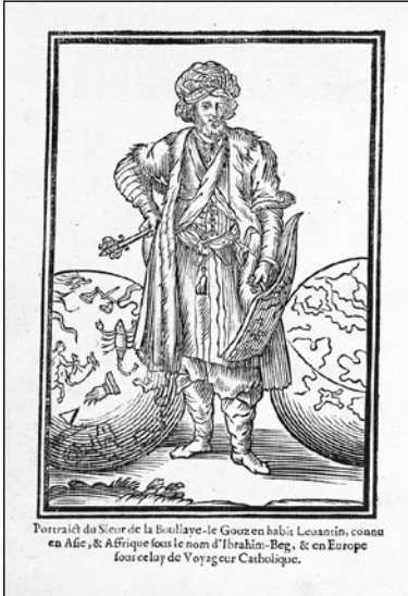
François Le Gouz de La Boullaye, frontispice des Voyages et observations du Sieur de La Boullaye-le-Gouz, 1657.

J'aimerais donc profiter de ces quelques pages pour montrer comment, à travers les récits de ces hommes, un autre islam se fait jour et se détache progressivement de l'image archétypale de l'Infidèle. Dès lors, le discours des Européens sur l'islam chiite devient bien moins une critique des manifestations de la foi (le « croire »), ou même du prosélytisme islamique (le « faire-croire »), que des limites de la croyance (le « trop croire »).