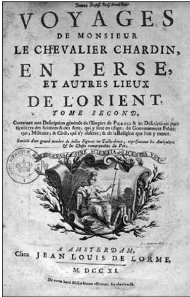
Voyages de Monsieur le chevalier Chardin en Perse et autres lieux de l'Orient

ses Voyages en Perse , consacré à la religion des Persans 35 . Il revendique d'ailleurs ses emprunts dans la préface de ce volume :