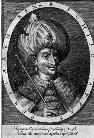
Shah 'Abbas I er , gravure par Dominicus Custos (source : Wikimedia)

leur expérience sous forme de relations, qui connaissent un grand succès d'édition et une large diffusion en Europe, fournissant aujourd'hui un matériau précieux sur la connaissance de la société safavide de l'époque moderne.