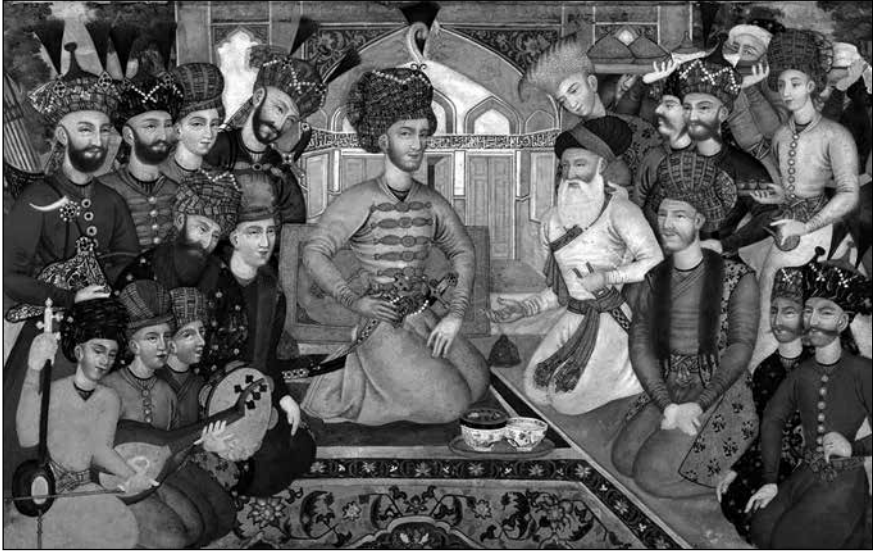
Shah Abbas II reçoit les ambassadeurs de l'Empire moghol

« Les Persans respectent plus la loi du Prince que la loi de Mahomet [...]. Aussi ont-ils comme principe de religion qu'il faut obéir au roi comme à Dieu » 29 .