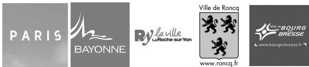
Illustration 2 : Exemples d'images de profil de PO

Les images de profil des PO sont figées dans une représentation symbolique de la ville. Son nom y figure toujours : ces images ne sont pas des photographies et convoquent logos et stylisations du concept urbain, plus que des illustrations de la ville.