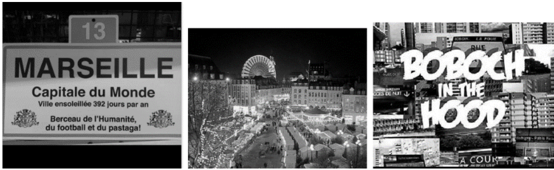
Illustration 3 : Images de profil des PP de Marseille, Lille et Bobigny

Certaines sont à vocation humoristique (Marseille), et tiennent un discours très mélioratif et emphatique, comme « ville ensoleillée 392 jours par an », et en tirent des caractéristiques positives, comme « berceau [...] du football et du pastaga ! » (Marseille). Le collage qui représente Bobigny est à part, parce qu'il s'agit d'une pochette d'album d'un groupe de rap local éponyme. Ce choix met donc à la fois l'accent sur la multiplicité urbaine (immeubles, station de RER) et sur la culture régionale. Ces musiciens utilisent le surnom affectueux de la ville, « Boboch ». La plupart des PP ont recours à la photographie d'un panorama connu, comme le bord de mer pour Brest ou Nice. Les citoyens la reconnaissent à travers ses éléments topographiques et l'attachent plus au concret que les PO.