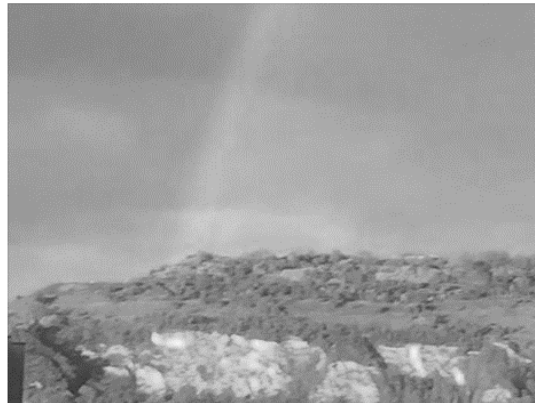
Illustration 4 : Exemple de jeu de piste urbain (PP de Rouen, 09/04/16)

Ce soir après la pluie! Magnifique! 😊 devinez où c'est? Je confirme que c'est à Rouen mais où? 😊