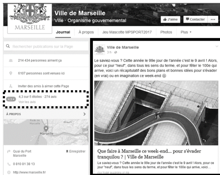
Illustration 1, PO de Marseille, capture d'écran au 8 avril 2016

Toutes les PO présentent plutôt des agendas culturels ou des informations concernant les transformations urbaines comme le changement de nom d'une rue ou travaux. FB permet aussi aux utilisateurs de noter la ville, comme n'importe quel endroit. Ce côté évaluatif est propre à ces plateformes, et rappelle les sites spécialisés dans les recommandations d'internautes comme Yelp . En revanche, c'est la ville entière qui est jugée, et non un seul de ses établissements. Ces avis apparaissent sur la page principale, mais celle-ci laisse surtout la part belle aux messages postés par les curateurs, qui publient des informations dans l'onglet « journal », celui qui s'ouvre automatiquement lors de l'accès à ce lieu numérique.