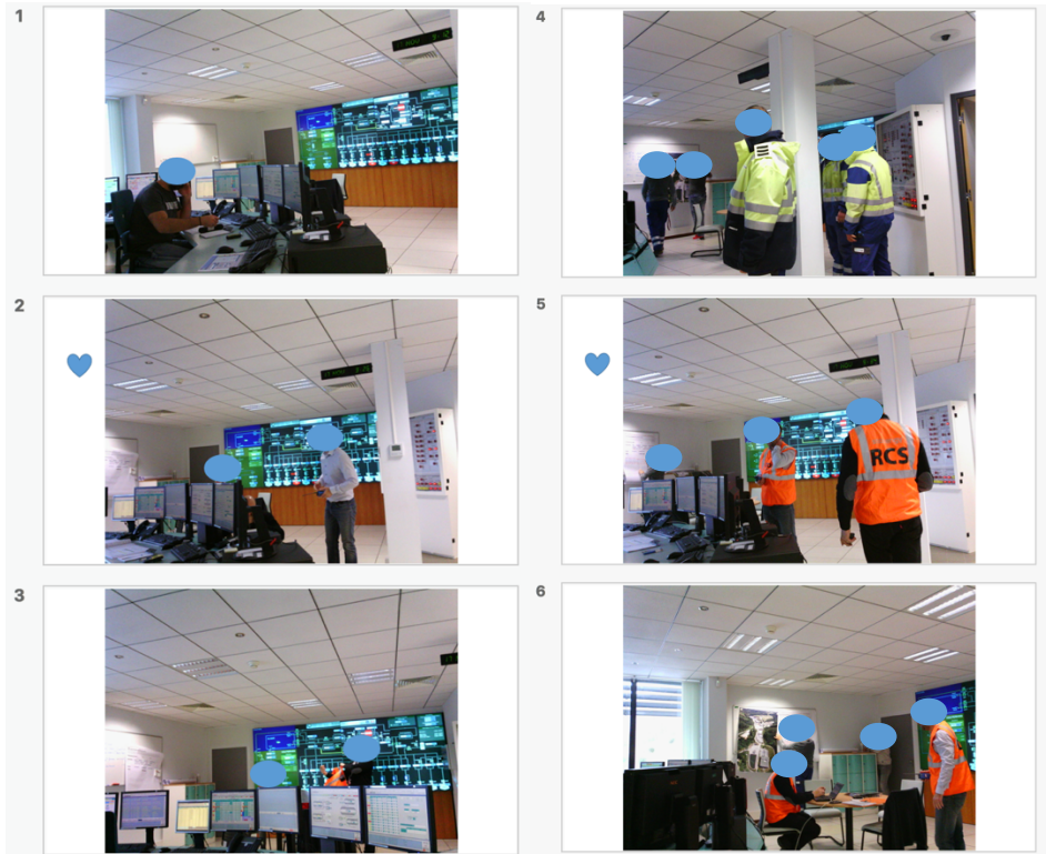
Figure 2 : Extrait de chronique photographique élaboré à partir de clichés automatiques entre la phase d'observation de la simulation et la phase de débriefing où il a été utilisé

les « éléments-clés » identifiés pendant l'observation, (ii) sélectionner les clichés correspondants et supprimer les clichés superflus (relatifs à un « temps faible » de la simulation ou étant de trop mauvaise qualité pour être exploités), et (iii) marquer les clichés correspondant à des éléments devant être prioritaires pour le débriefing (utilisation d'un symbole « cœur » en l'occurrence, voir la Figure 2). Cette opération a été réalisée en une dizaine de minutes et a abouti à la sélection d'une soixantaine de clichés. De cette manière, et en revenant au besoin à ses notes manuscrites, l'intervenant a obtenu une chronique photographique de la phase de simulation. Un extrait est fourni dans la Figure 2.