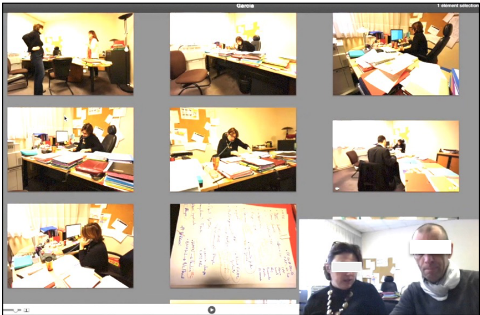
Figure 4 : Exemple de corpus mosaïque intégrant différentes traces d'activités (photos, vidéos...)

Le corpus mosaïque présenté ici était composé de 25 traces d'activités recueillies en deux heures avec une cheffe d'établissement débutante. Les situations de travail ont été documentées dans une dizaine d'espaces différents (dont une « liste de points d'urgence » produite la nuit, c'est-à-dire hors temps de travail formel) et sans relation particulière les unes aux autres. Du fait de la très forte pression temporelle ressentie par la cheffe d'établissement (et de l'impossibilité de conduire l'entretien hors temps de travail), la conduite d'un entretien à partir de l'ensemble des traces d'activité n'était pas envisageable. De plus, l'entretien (qui a duré environ une heure) a été interrompu par plusieurs appels téléphoniques considérés comme prioritaires par la cheffe (rectorat, commissariat, juge d'instruction, etc.), par plusieurs sollicitations de son secrétariat, et par plusieurs « minimessages » à caractère d'urgence. Compte tenu de ces contraintes, nous avons contractualisé ensemble d'effectuer une « retranscription synthétique » de l'expérience vécue en ne mobilisant que les situations les plus significatives de son point de vue, sans se soucier de leur déroulement chronologique. La cheffe a alors pointé d'elle-même, dans l'interface du corpus mosaïque, les situations dans lesquelles elle avait ressenti des émotions particulièrement significatives, vécu des dilemmes spécifiques, conduit des enquêtes, etc.