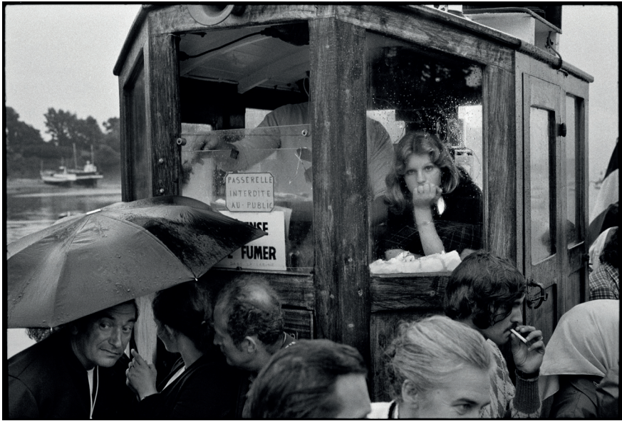
Guy Le Querrec, Sur la vedette effectuant la traversée entre l'île de Bréhat et la Pointe de l'Arcoüest, jeudi 14 août 1975

Viva, l'agence du renouveau documentaire où travaille son épouse Martine Franck. Guy Le Querrec n'est en effet pas le seul à postuler, et son collègue Richard Kalvar, lui aussi membre de Viva, rejoint Magnum cette année-là. Le tour de Guy Le Querrec vient dès l'année suivante, et tous deux obtiennent le statut de membre à part entière en 1977, suivis par Martine Franck elle-même au début des années 1980. Comme le craignait Henri Cartier-Bresson, Viva ne survit pas à ces départs successifs, alors que le modèle de la photographie documentaire demeure fragile. L'agence dont le nom devait sonner comme un cri de joie ferme ses portes en 1982.