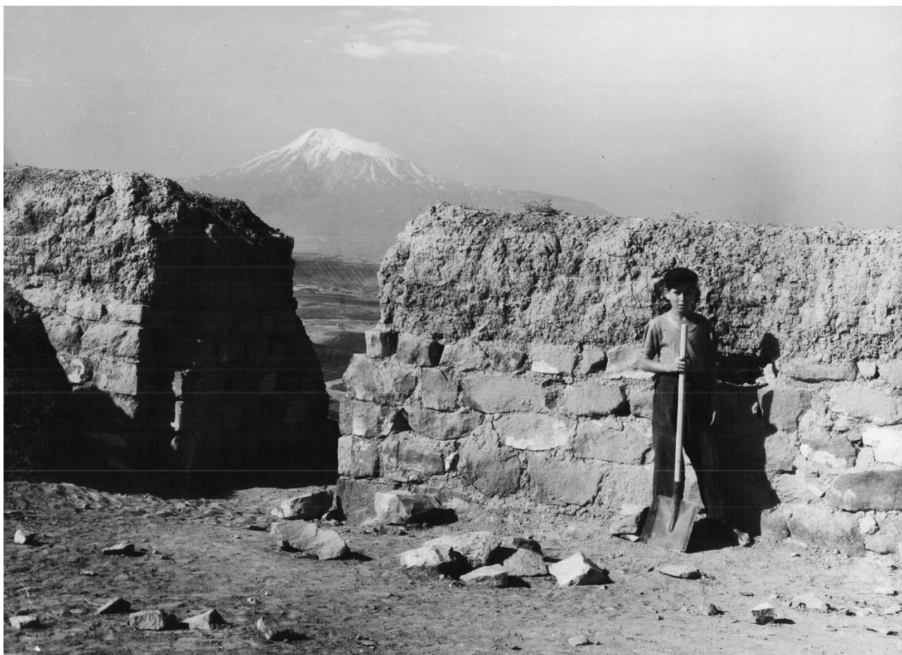
Fig. 10 : site Ourartou, Karmir Blour

Lors des échanges ils ont mesuré l'importance de la protection des sites en terre, la richesse des expériences internationales de l'Europe aux USA, en Iran, Afghanistan...