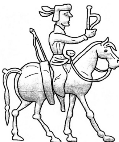
Fig. 7. Dessin d'après une monnaie d'Azilés : le roi portant un vêtement civil et tenant le fouet (Dessin par François Ory)