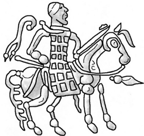
Fig. 5. Dessin d'après une monnaie d'Azès I : le roi à cheval vêtu de la cataphracte, tenant la lance (Dessin par François Ory)