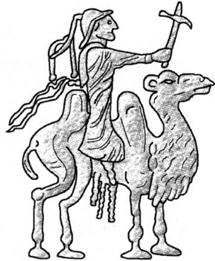
Fig. 3. Dessin d'après une monnaie d'Azès I : le roi sur un chameau bactrien tenant une hache (Dessin par François Ory)