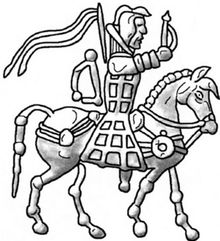
Fig. 4. Dessin d'après une monnaie d'Azès II : le roi à cheval vêtu de la cataphracte, tenant le fouet (Dessin par François Ory)