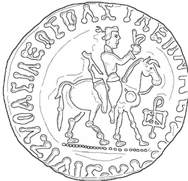
Fig. 1. Dessin d'après une monnaie d'Azilisès : le roi portant un vêtement civil et tenant le fouet (Dessin par François Ory)

L'équipement du roi cataphractaire figuré sur les monnaies indo-scythes nous apporte un élément non négligeable d'appréhension des nomades conquérants du royaume indo-grec, par ailleurs très peu connus. Il est indéniable que la cataphracte et les armes montrent leur appartenance à la communauté scythe. Le choix de ce type comme droit principal du monnayage est révélateur de l'idéologie des nouveaux maîtres des régions du Gandhâra. Le roi se présente comme chef d'armée. Il choisit l'équipement d'élite de ces corps. La confection d'une cataphracte devait être longue et son coût élevé. La supériorité de cet équipement sur ceux des peuples voisins était sans doute un élément dissuasif d'agression. Le choix des armes auxquelles est associé le port de la cataphracte est aussi symptomatique d'une appartenance culturelle au monde scythe et d'une volonté de propagande. En effet, les armes, outre leur fonction défensive, ont dans ces représentations le rôle d'attribut du pouvoir.