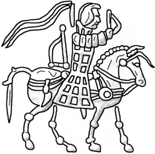
Fig. 2. Dessin d'après une monnaie d'Azès II : le roi à cheval vêtu de la cataphracte, tenant le fouet (Dessin par François Ory)