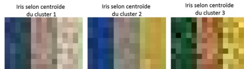
FIG. 2 – Visualisations des données IRIS coloriées à l'aide des trois profils couleurs représentatifs

classe Setosa, les cinq suivantes à la classe Versicolor et les 5 dernières à la classe Virginica. Pour tous les profils, et conformément à la littérature, nous pouvons aisément séparer la classe Setosa des autres. Selon nous, sur ces données, nous pouvons distinguer plus nettement, à l'aide du centroïde du deuxième cluster, les classes Versicolor et Virginica qu'avec les autres profils représentatifs.