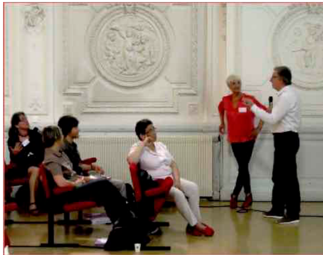
Figure 1 : Colloque « l'Ere du Temps », Nice 2018

L'être humain, comme tout être vivant, est un être de relations, du début jusqu'à la fin de sa vie. Nous sommes nécessairement inscrits dans le temps comme dans l'espace et nous n'y pouvons rien !