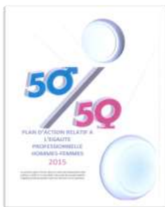
Page de garde d'un plan d'action [Commerce, Petite entreprise, n° 144]

L'objectif de proportionnalité infuse en fait tous les domaines, qu'il soit formalisé ou non sous une forme chiffrée. L'égalité est ainsi toujours envisagée sous une forme quantifiée et relative, au détriment d'une approche plus qualitative. Ainsi, en matière de formation, 29 textes visent une répartition égale entre les femmes et les hommes de l'entreprise. Il n'est jamais envisagé, par exemple, que les femmes puissent bénéficier de plus de formations que les hommes afin de compenser les inégalités, à distance donc de toute analyse en termes d'« action positive » autorisée pourtant par le code du travail, uniquement en faveur des femmes.