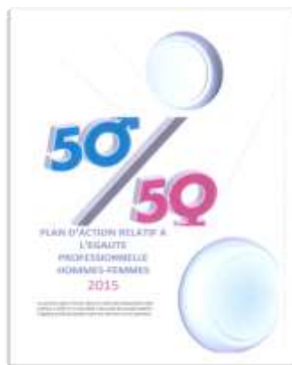
Page de garde d'un plan d'action [Commerce, Petite entreprise, n° 144]

L'objectif de proportionnalité infuse en fait tous les domaines, qu'il soit formalisé ou non sous une forme chiffrée. L'égalité est ainsi toujours envisagée sous une forme quantifiée et relative, au détriment d'une approche plus qualitative. Ainsi, en matière de formation, 29 textes visent une répartition égale entre les femmes et les hommes de l'entreprise. Il n'est jamais envisagé, par exemple, que les femmes puissent bénéficier de plus de formations que les hommes afin de compenser les inégalités, à distance donc de toute analyse en termes d'« action positive » autorisée pourtant par le code du travail, uniquement en faveur des femmes.