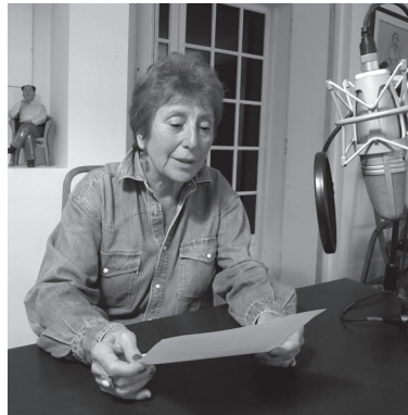
..... Enregistrement audiophonique de Marie-José Mondzain.

19 Cité par Henri Godard, op. cit. , p. 237.