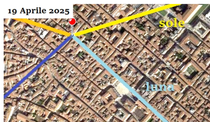
Figura 2: Usando il software The Photographer's Ephemeris si può vedere in che direzione sorgono e tramontano sole e luna. Il giorno 19 Aprile del 2025, la luna sorgerà nella direzione più meridionale possibile (retta blu chiaro).

Dalle immagini satellitari della città, noi vediamo che la direzione delle vie, che ricalcano i decumani, è di circa 131 gradi, misurati dalla direzione del nord geografico. L'azimut del sorgere del sole, al solstizio d'inverno, è di circa 124 gradi e quindi la direzione dei decumani è più a sud di almeno sette gradi. La città non è stata quindi orientata col sorgere del sole, perché, alla latitudine di Piacenza, il sole non può sorgere con un azimut maggiore di quello del solstizio d'inverno. Solo la luna può essere chiamata in causa, quando essa sorge nella direzione più meridionale possibile, durante un lunistizio maggiore.