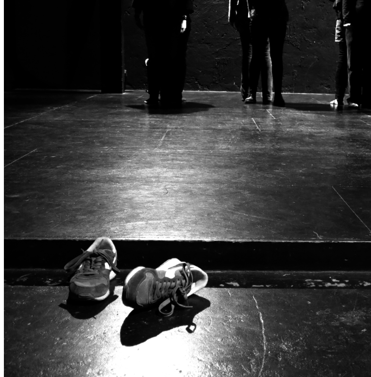
Figure 1- Sortir de soi, un atelier pour interro