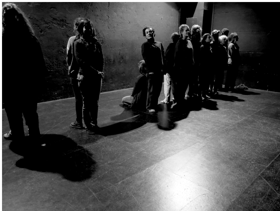
Figure 3- Le théâtre déclencheur fait place à la plus petite échelle des productions de savoirs : le corps.

de la recherche que l'implication des corps des chercheur.e.s a été soulevée. Suivant l'idéal d'une science positiviste, les chercheur.e.s et notamment les géographes sur leur terrain ont longtemps prétendu.e.s à une neutralité dans leur observation, garantie d'une objectivité. Cette assertion nie pourtant que les chercheur.e.s ont des croyances, des valeurs, mais aussi des corps qui influencent les conditions d'accès au savoir. En dénonçant cette « ruse divine » qui consisterait pour le ou la chercheur.e « à tout voir depuis nulle part », Donna Haraway (2007) a renouvelé les épistémologies de terrain. Il est aujourd'hui admis qu'entre les corps se jouent des rapports de force silencieux, à l'origine de violences manifestes -quand bien même symboliques. Dire que la recherche est située, c'est dire que les chercheur.e.s ont une couleur, un âge, un genre, une classe, une caste ou encore des traces sur la peau (en dépit de la pluralité de nos identités et de ce que l'on peut cacher). Or tous les corps ne peuvent pas prétendre au savoir. Il y a généralement les savant.e.s d'un côté, et celles ou ceux qui ont les savoir-faire de l'autre ; de la même manière qu'il y a des expert.e.s et des enquêté.e.s qui appartiennent à des mondes différents. Pour éveiller l'attention sur ces lignes de fractures dues au privilège de la connaissance, la chercheuse et artiste Grada Kilomba compare le passé colonial à un masque qu'il n'est pas possible d'ôter (Kilomba, 2015).