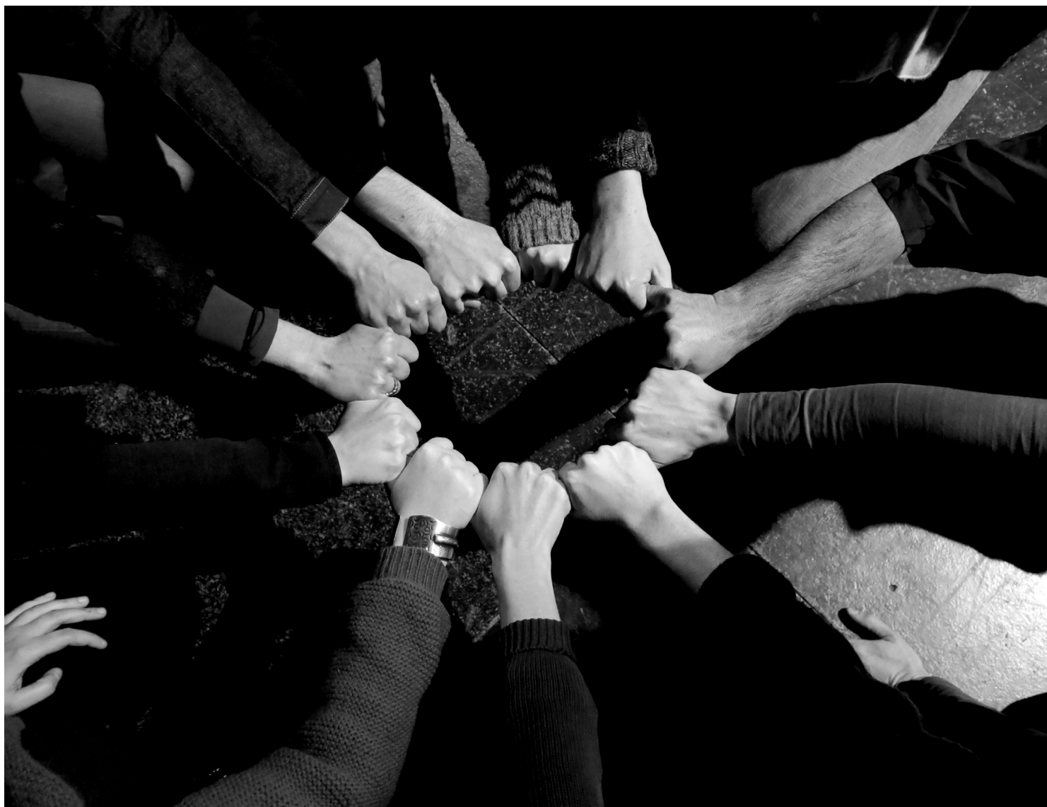
Figure 7- Fédération finale (moins les participant.e.s qui ont dû partir parce que l'atelier s'est prolongé).