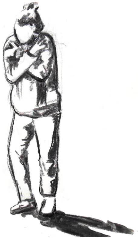
Fig.6a- Une des statues incarnées

Ici, plusieurs participant.e.s font état de la gêne ressentie vis à vis d'un vigile de grande surface, avec ce sentiment désagréable que certains peuvent jouer du théâtre pour se divertir pendant que d'autres n'ont pas le privilège d'accéder à ce type d'activité. D'autres participant.e.s racontent au contraire le plaisir ressenti de la lenteur de leur marche qui a été l'occasion de découvrir les différentes textures du sol. A cette étape, les participant.e.s commencent à entrer dans leurs expériences corporelles mais révèlent avoir du mal à lâcher ce contrôle qu'impose leur mental. C'est ce pour quoi le théâtre déclencheur a besoin de plusieurs étapes avant d'accéder à