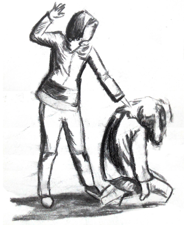
Fig.6b- Une des postures en binôme

Ensuite l'ensemble du groupe donne un titre aux tableaux créés (tels que : 'la colonisation' ; 'promenons-nous avec notre honte' ; 'ne recommence pas' etc). L'exercice évolue en mettant ces biômes en mouvements. Les uns après les autres, des binômes ont été invités à présenter au reste de l'assemblée leurs déplacements, devenus des scénettes, afin de les soumettre à l'interprétation collective. Une partie de la salle s'est ainsi transformée en spect'acteur. Son but : commenter la marche qui se donne en spectacle, en essayant de préciser : qui peuvent