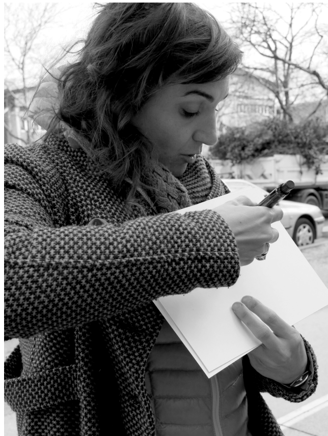
Fig. 4- Consigne de parcours et cartes sensibles