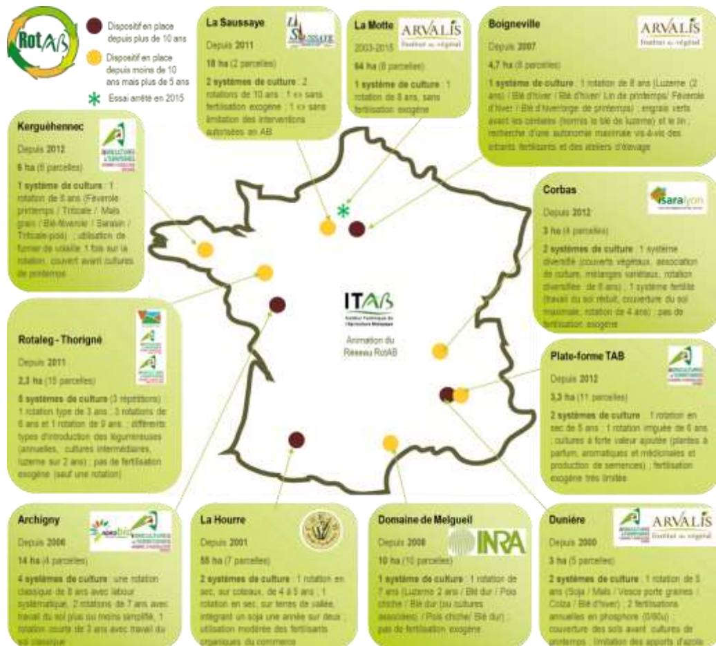
Figure 1 : Localisation et principales caractéristiques des dispositifs d'évaluation de systèmes de grande culture en AB du Réseau RotAB partenaires du projet InnovAB.

Nous avons choisi de valoriser un réseau d'essais systèmes de longue durée pour évaluer des stratégies variées et adaptées à leur contexte, mais aussi pour capter la diversité des réponses des systèmes aux stratégies et leviers mobilisés. Il s'agit également d'appréhender les processus biologiques et écologiques qui sous-tendent les dynamiques d'évolution de la fertilité des sols et de la flore adventice, qui ont lieu sur des temps longs.