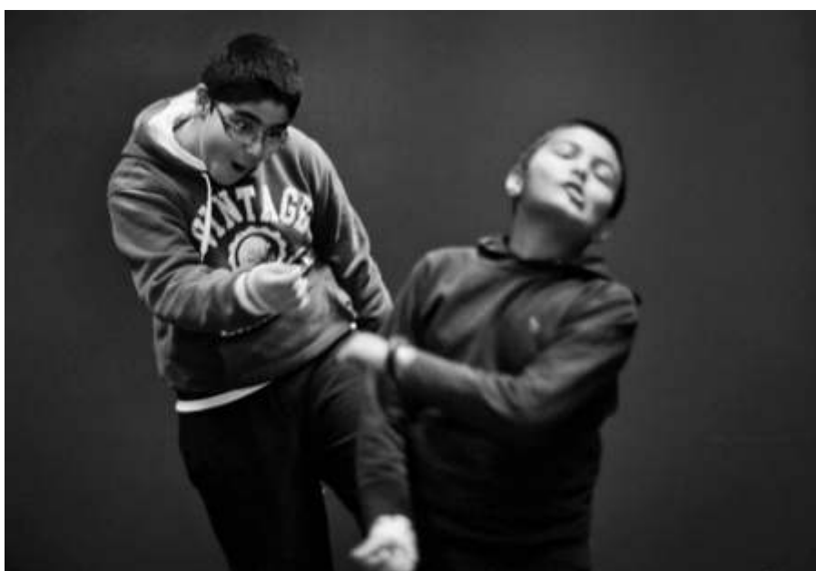
Figure 2 : Echauffement corporel. Thèse Auteur en cours.

J'ai choisi une méthode mixte et j'utilise des outils qui me permettent d'analyser plusieurs niveaux. Pour cette publication, j'ai extrait des exemples dans le niveau méso (la classe). Je m'appuie sur des observations (une captation vidéo et mon journal de bord), et dix entretiens semi-directifs (deux comédiennes, deux enseignants, six élèves). D'autres outils dont il ne peut être question ici étaient par ailleurs ma recherche.