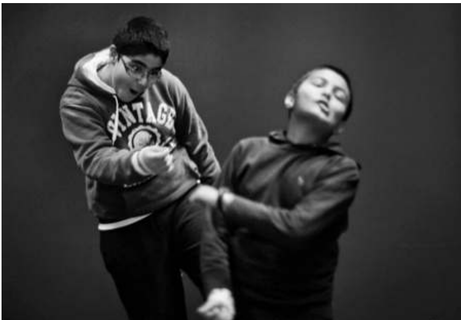
Figure 2 : Echauffement corporel. Thèse Auteur en cours.

J'ai choisi une méthode mixte et j'utilise des outils qui me permettent d'analyser plusieurs niveaux. Pour cette publication, j'ai extrait des exemples dans le niveau méso (la classe). Je m'appuie sur des observations (une captation vidéo et mon journal de bord), et dix entretiens semi-directifs (deux comédiennes, deux enseignants, six élèves). D'autres outils dont il ne peut être question ici étaient par ailleurs ma recherche.