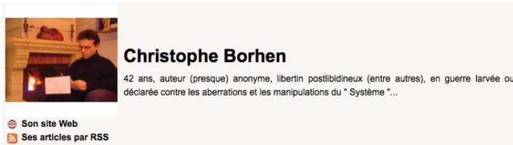
fig. 3 - Un auteur d'AgoraVox contre le « système » (février 2009)

discours, variant aussi avec le degré d'engagement de ces « journalistes citoyens » 7 .