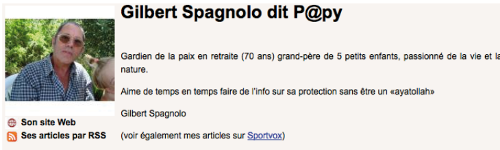
fig. 2 - Un auteur d'AgoraVox (février 2009)

Le profil précis des rédacteurs des nouveaux médias sur Internet est cependant encore mal connu. On ignore souvent les démarches personnelles qui conduisent ces citoyens à s'investir dans la rédaction de papiers rendus publics sur le web. L'objet de cet article est d'analyser, sur un plan qualitatif, deux points essentiels du parcours des contributeurs aux nouveaux médias : les logiques et dispositions personnelles qui les poussent à proposer des articles non rémunérés, ainsi que leurs démarches et méthodes de travail.